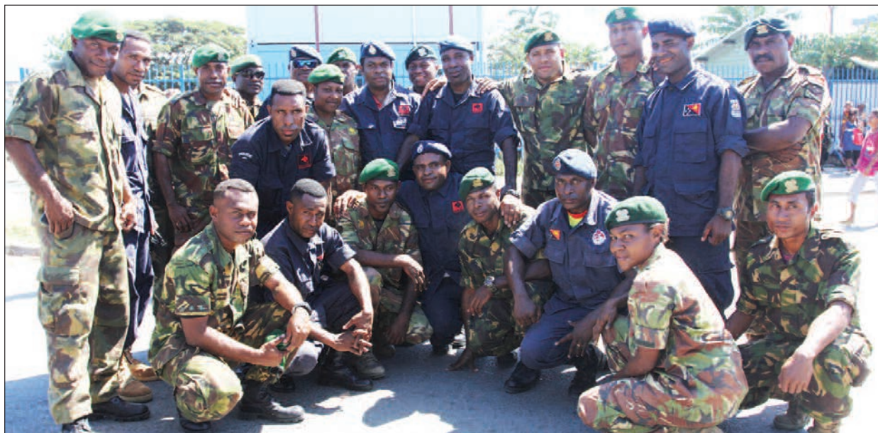
Ol join Polis, Ami na CS redi long wok long NCD na Sentral. Ol tu bai stenbai long Oro na Milen Be.

Dispela pered mas long Sarere long Boroko i statim wok operesen bilong NCD na Sentral long taim bilong ileksen. Planti ol publik manmeri na pikinini i bin stap tu long lukim dispela pered.