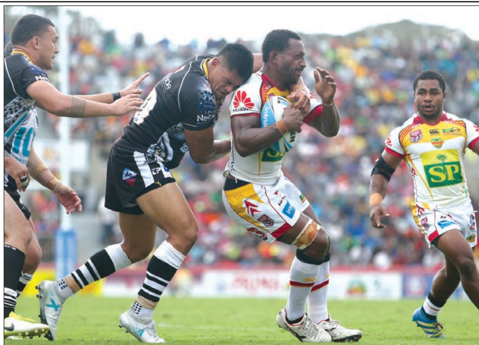
Magpies pilaia i pasim ai na taitim bun long takelim mangi PNG.

Sampela disisen bilong referi bilong Japan i no go gut long sampela ol sapota bilong PNG Kapul, ol olupela soka pilaia na ol referi bilong PNG.