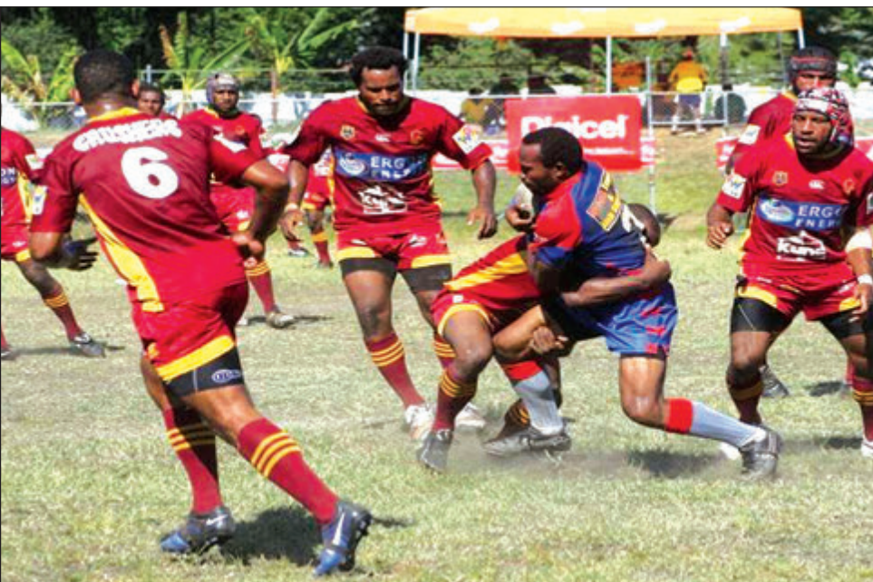
Fainal i kamap namel long Emergency Line Pacific XXX na SSY Brothers long Simbu Ipatas Kap salens.

COCA-Cola Ipatas Kap salens long Simbu i lukim olsem namba wan Tim husat ol i bin givim Gol Pas long go het long neks stej bilong Ipatas Kap em Emergency Line Pacific XXX.