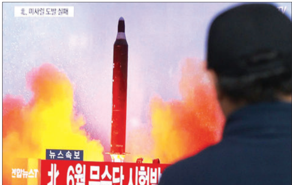
Saut Korea TV ripot i tokaut long Not Korea i sutim roket bom.

Not Korea i sutim roket bom i go 500km long solwara bilong Japan