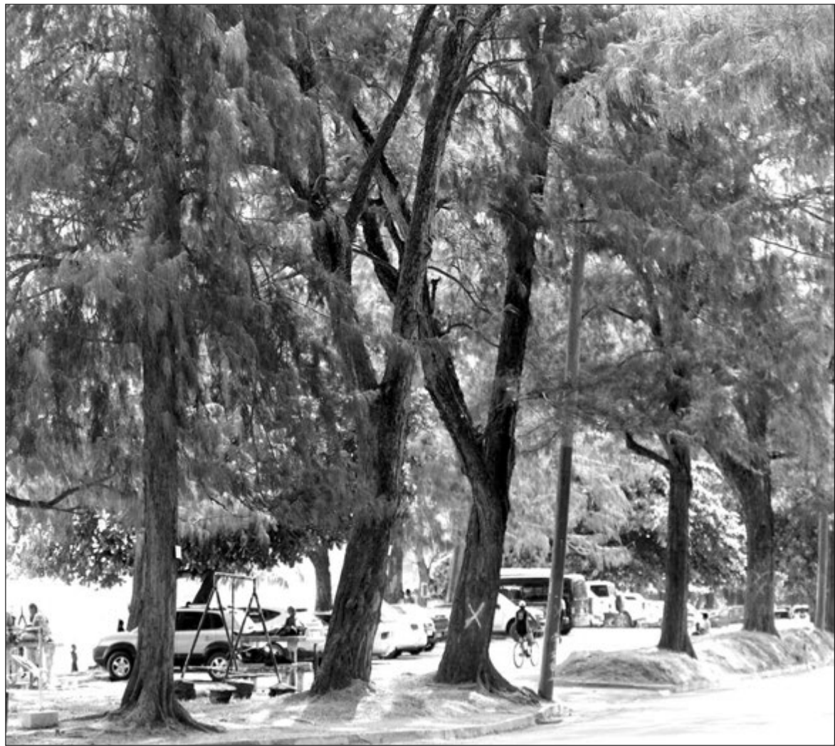
Ela Beach nambis bai senis long bihain taim. Ol dispela yar diwai i stap long tumbuna taim yet i kam tasol NCDC bai katim daun long nem bilong divelopmen bilong Pot Mosbi siti.

“Sapos mipela bai kilim tupela pik olsem sakrifais bilong ol dispela diwai tu em bai mipela i mekim. Mi laikim rot bai go het. Bikpela samt-ing em ol lain i save stap long Siti i mas amamas long ol senis i wok long kamap.