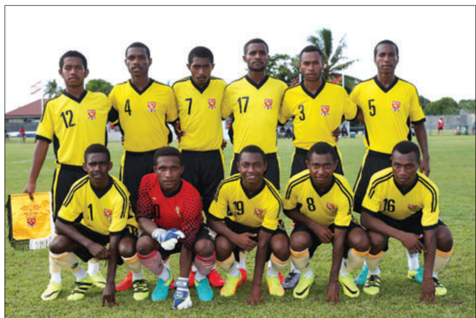
PNG Anda 17 tim i redi long salensim ol Vanuatu long Osenia Futbal Sempionsip. Dispela em i namba tu gem bilong ol long Grup A salens.

Ol pilaia na opisal bai holim wanpela bung long painim nupela taim na hap bilong resis bihain.