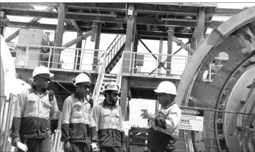
Aweanes fil trening long Laim Mill long BSK Rifaineri.

Presiden Gao i tokaut tu olsem long sait bilong ol PNG Nesenel wok lain, wok nau bai stat long gredim ol wok lain bihainim wok ol i mekim na save long em, operesional kompetensi na wanem wok ol i wokim na i save gut tru long en na i save mekim oltaim.