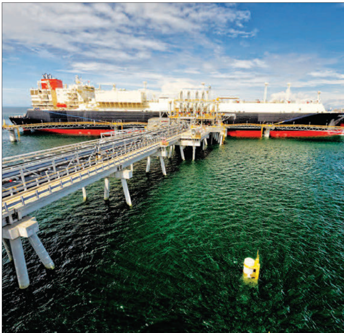
MV Papua em i wanpela bikpela sip bilong karim PNG LNG i go long Esian maket.

Praim Minista Peter O'Neill i tok ExxonMobil i bilip strong long