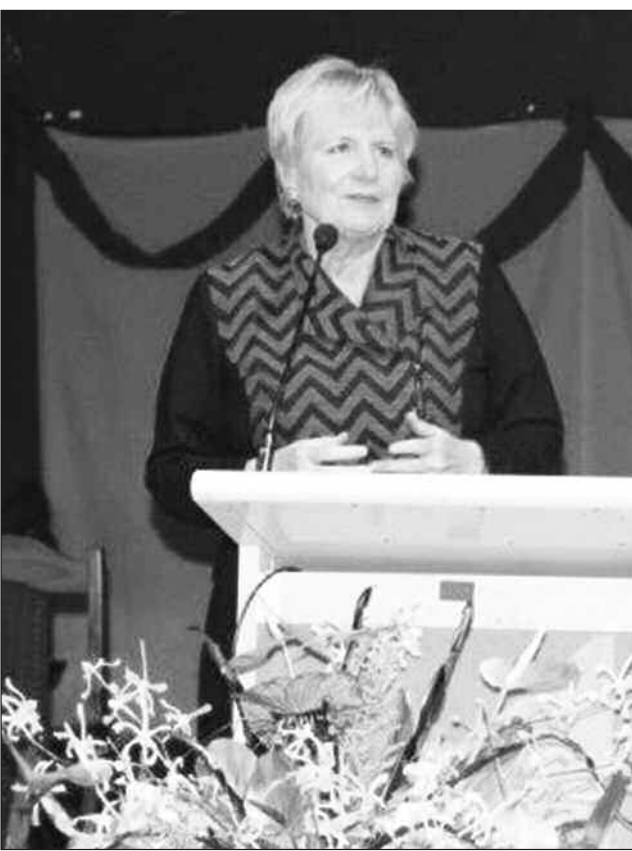
Embasada Catherine Ebert-Gray i tok tenkyu long olgeta lain husat i bin kamap long 2017 PNG Wimens Forum long Hailans rijon.

I bin gat planti toktok i kamap long nesanel ileksen na long ikononi bilong kantri. I bin gat ol liklik woksop i toktok long komyunikesen skil, helt, Wimen in Politik na wanem samting i kamap gut long Pasifik na kra i bilong ol meri long politik.