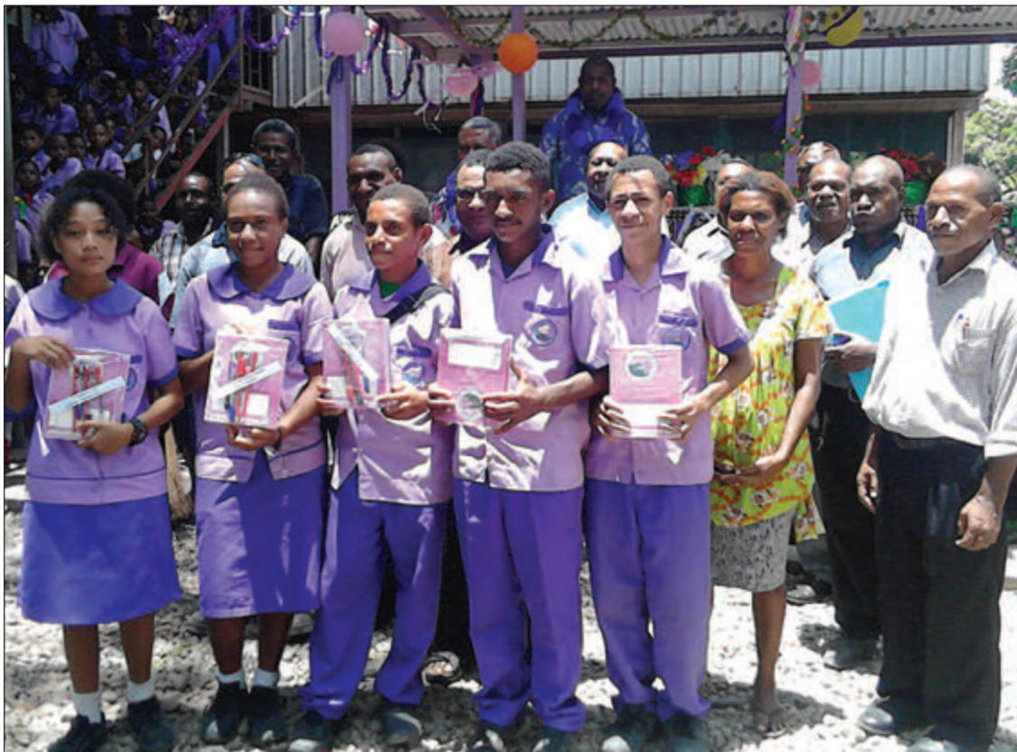
Ol skul sumatin, papamama, tisa wantaim mausman bilong Treid Pasifik na NCD Edukesen Divisen opisa i sanap long kisim poto wantaim ol lening material skul i kisim.

Tasol long taim bilong kisim sumatin bai sain wantaim ol papa-