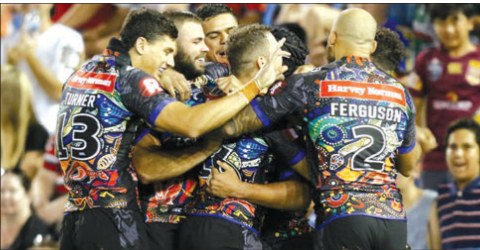
Ol Indigenous All Stars i amamas bihain long Johnathan Thurston i putim trai.

JOHNATHAN Thurston i stap long gutpela fom taim tim bilong em i win namba 4 taim long ol 7-pela resis na nau ol i stap pas long ol-geta yia resis.