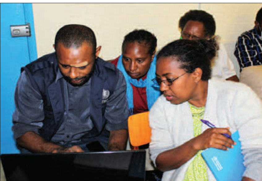
Ol lain long trening long Goroka Provinsal haus sik i kisim sampela teknikal instraksen i kam long wanpela teknisen bilong Wol Helt Ogenaisesen (WHO) long taim bilong lonsing bilong HINARI woksop long Goroka long Tunde dispela wik.