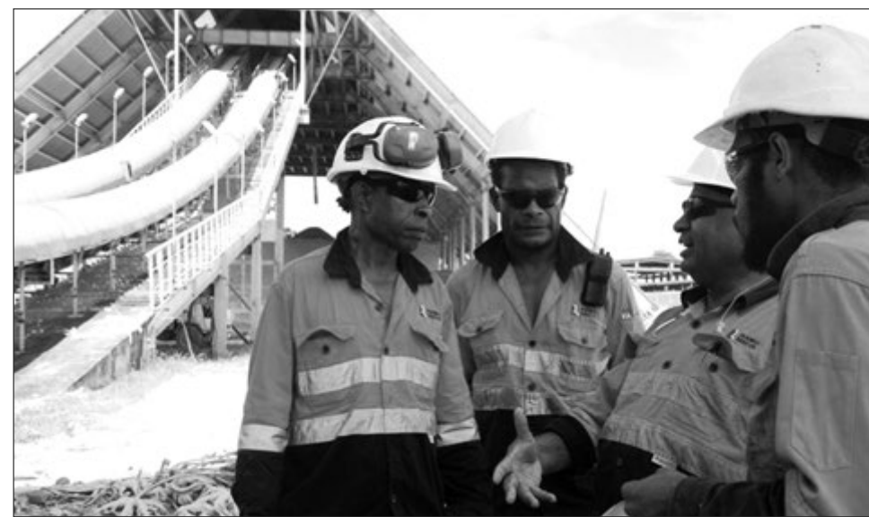
Salens long ol opereta long save gut long ol ikwipmen na proses.