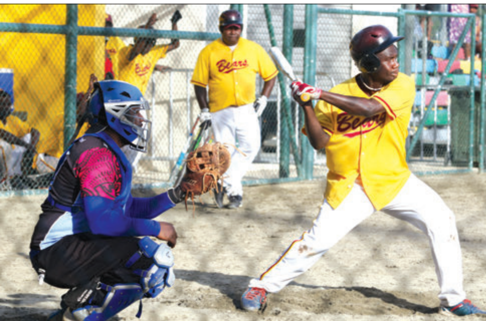
Beta bilong Bears i swingim bet tasol i no kisim bal.