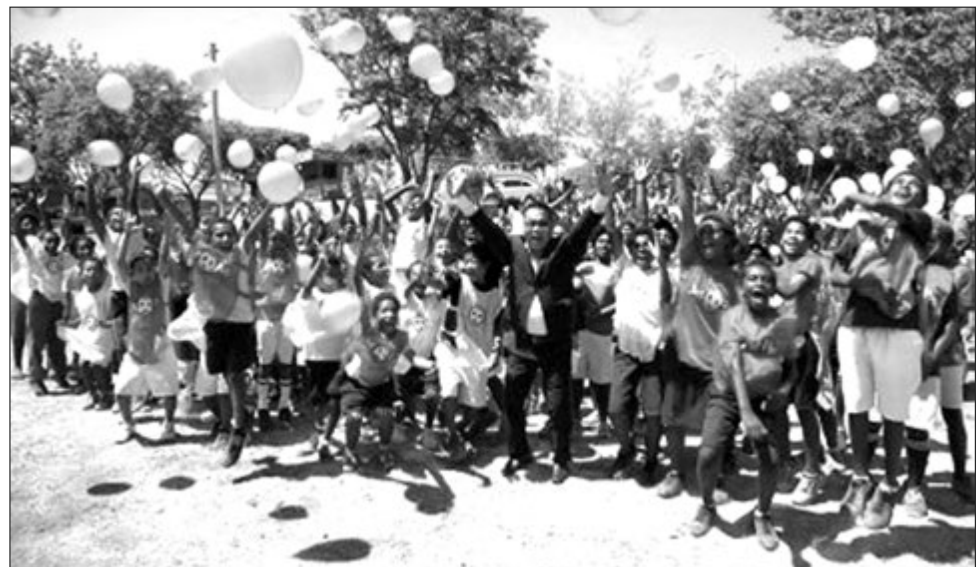
Poto i soim 2015 Universal Children's Day long PNG.

Lo bilong Tution Fee Free (TFF) edukesen long Papua Niugini em i wanpela samting bilong lap long en, long wanem em i no wok.