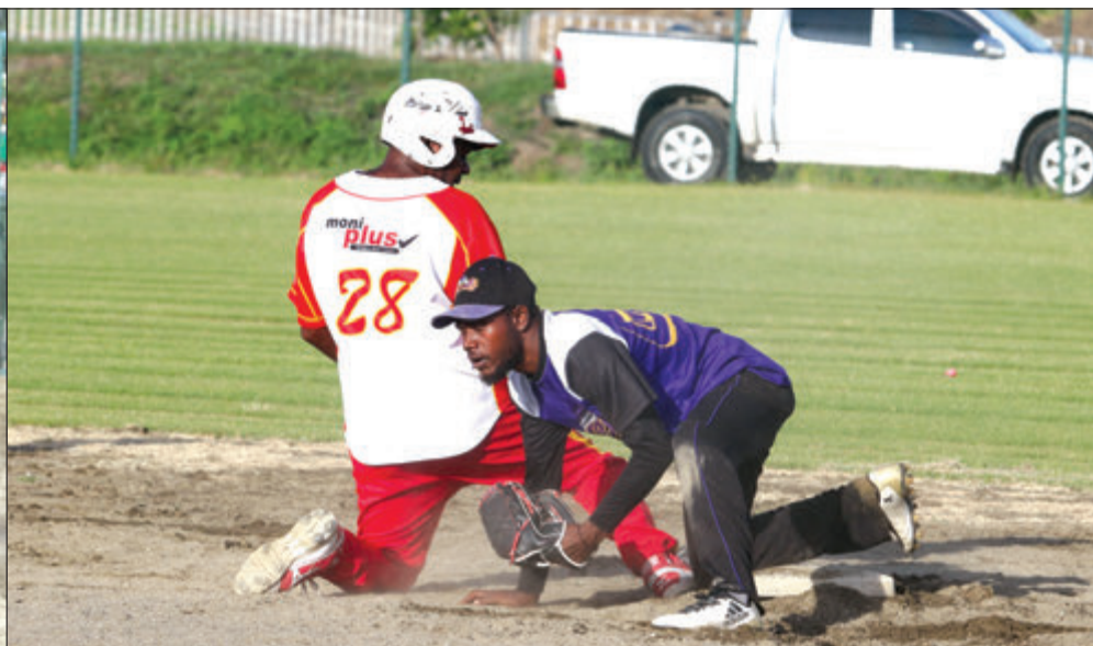
Rana bilong Gazelle i kisim bes taim pilaia bilong Saints i traim long autim em long namba tu bes.