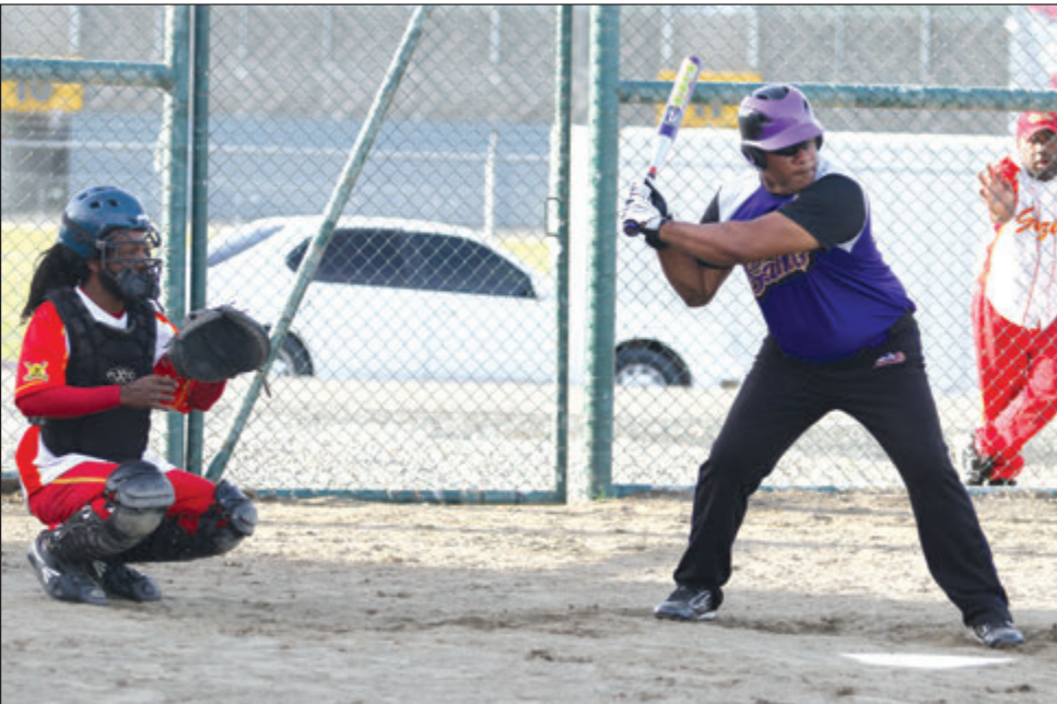
Bikpela beta bilong Saints i redi long paitim bal long pilai bilong ol wantaim Gazelle.