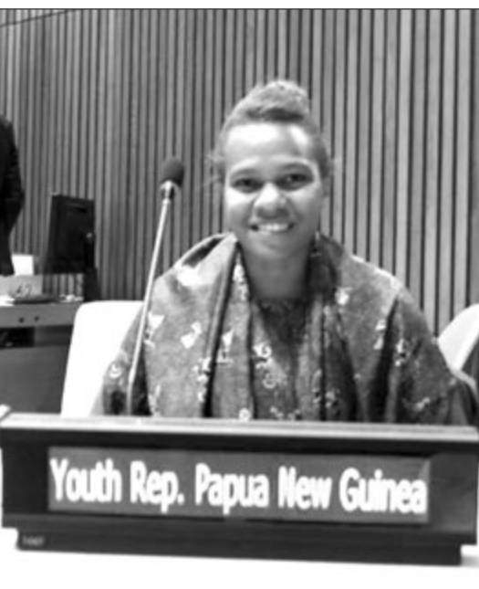
UN SDG Yut sempion, Raylance Mesa i go long New York long nem bilong SDG gols.