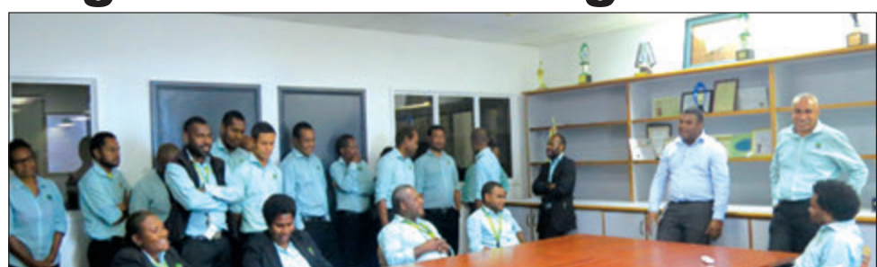
Mista Tarutia i toktok long ol wok manmeri bilong NCSL.

“Long larim NCSL i kamap olsem arapela bikpela benk na givim wankain sevis, wok