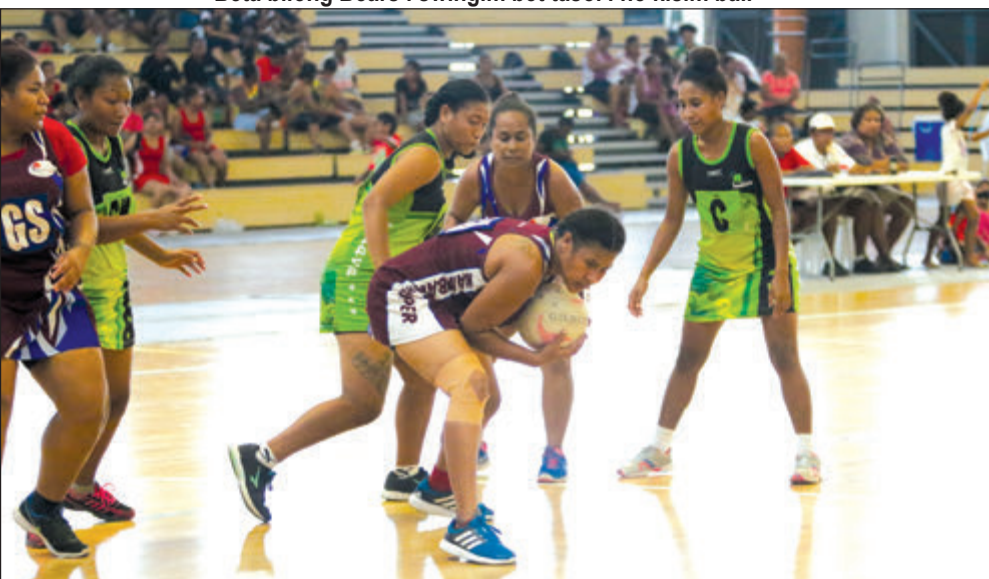
Pilaia bilong Nambawan Supa i haitim bal long bros bilong em na ol pilaia bilong Hodava i lukluk.