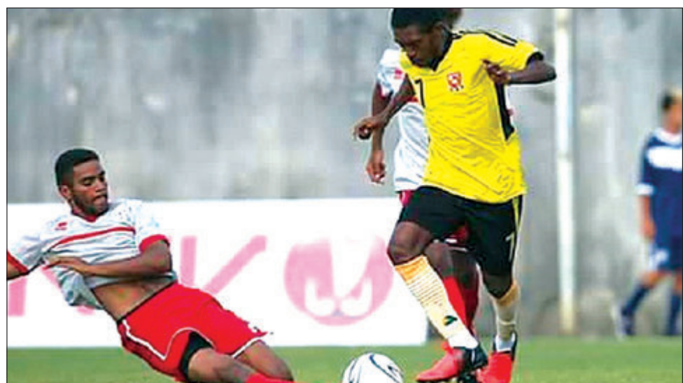
Pilaia bilong Nu Kaledonia na pilaia bilong PNG i pait long kisim bal.