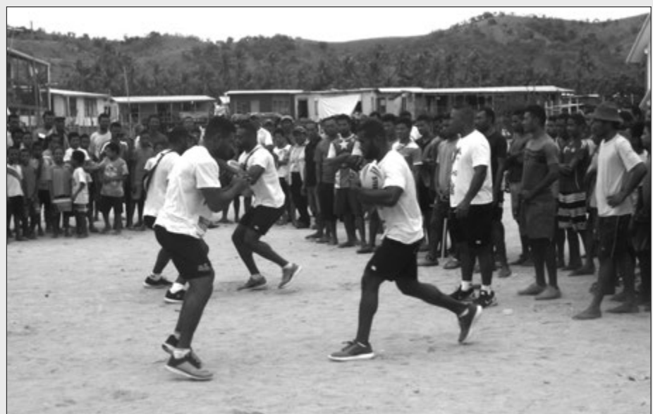
Ol pilaia bilong ol Hunters i soim sampela teknik na skil bilong takel wantaim ol Porebada Bulldogs.

Long pinisim sesen, ol Hunters pilai i bin givim 8-pela ragbi bal long ol 4-pela ragbi asosiesen wantaim ol kep, plak, t-siot, weit beg na posta bilong Hunters.