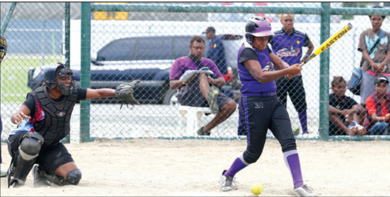
Beta bilong Saints i kaikai tit long paitim bal long pilai bilong ol wantaim Yokomo.