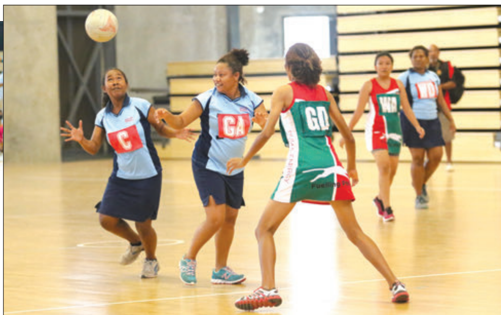
Pilaia bilong EFM i ran long spes taim wan pilaia bilong em i pasim bal taim pilaia bilong Puma Energy i putim was long praivet kampani netbal.