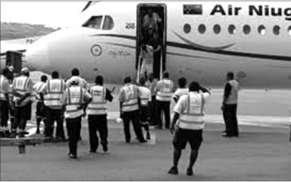
Ol polis long Jacksons Intensenel ples balus long Pot Mosbi.

Australia na Papua Niugini i no ken rausim nating ol asailum sika long Manus ditensen senta taim ol loya i wok long lukluk yet long keis bilong ol asailum sika na ol refuji.