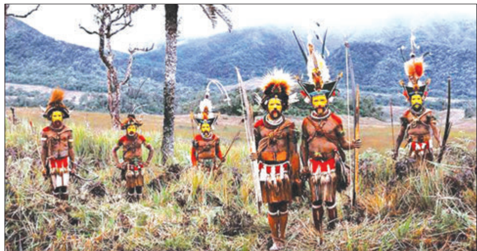
Ol man Hela i bilas na holim banara long as bilong Ambua maunten long Tari Gap.