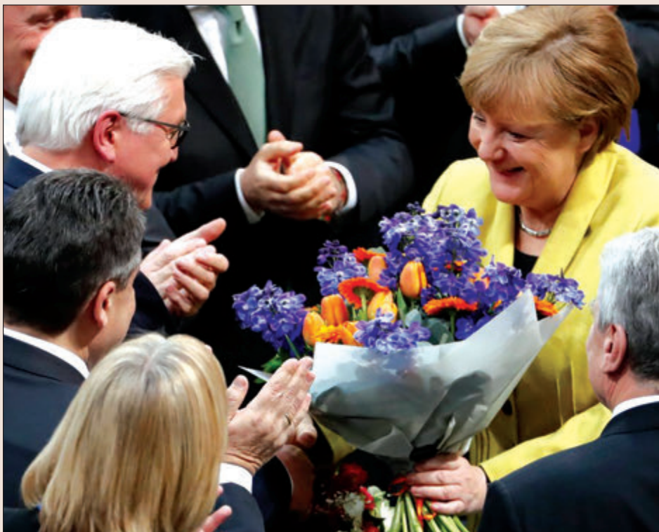
Angela Merkel Sansela bilong Jeman i tok amamas long Walter Steinmeier i kamap presiden bilong Jeman.