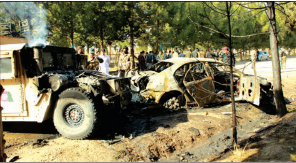
Ol kar i bagarap long taim wanpela bom i pairap long Sarere na kilim 7-pela pipel.

Wanpela ripot bilong Yunitet Nesens (UN) na ol lokal nius tu, i tok moa long 18 pipel i bin dai long Helmand provins long Afganistan bihain long ol balus bilong USA i bin bomim long dispela hap. Planti bilong ol lain i dai em ol meri na pikinini.