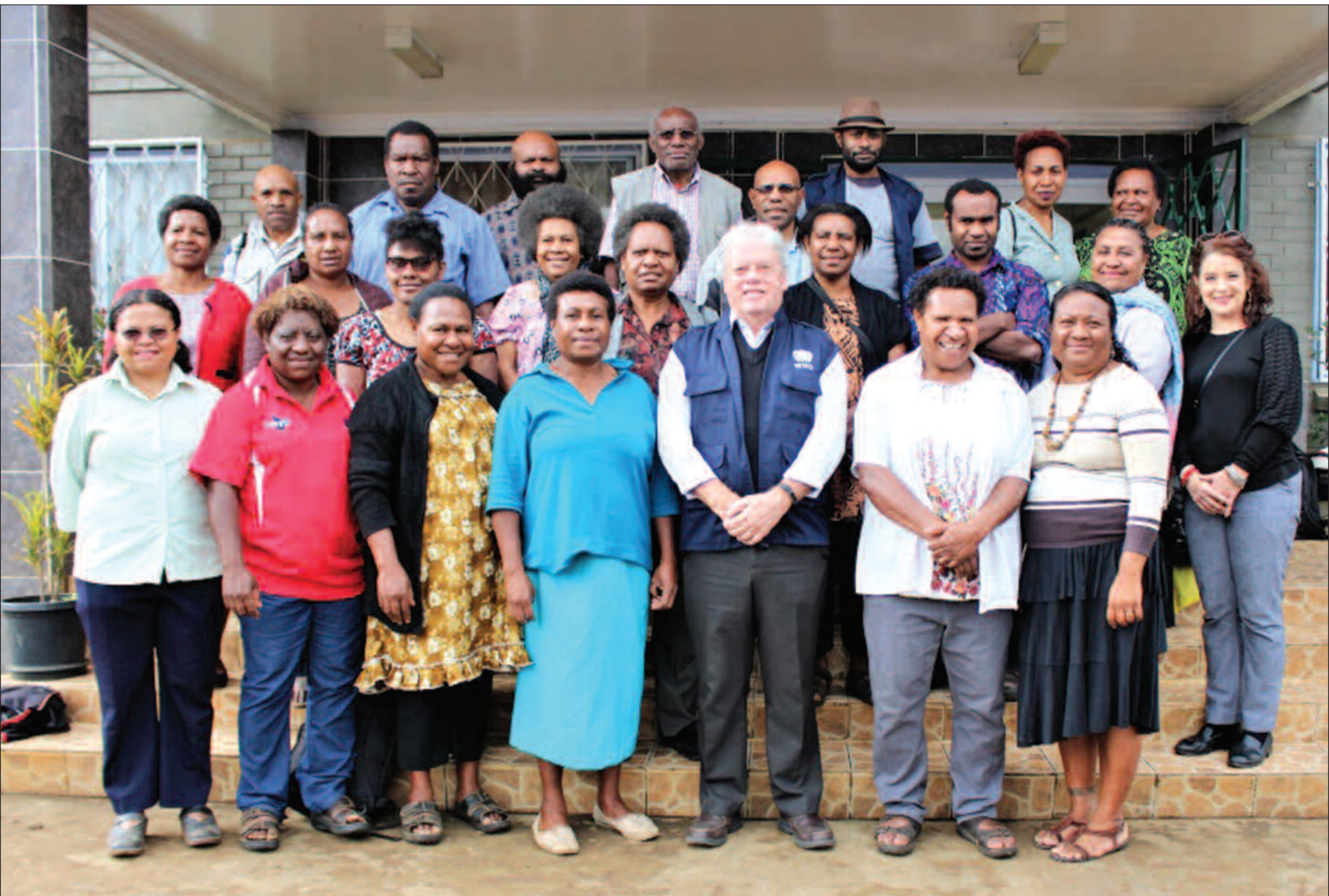
Ol patisipens wantaim ol representative bilong Wol Helt Ogenaisesen (WHO) i sanap na kisim poto bihain long lonsing bilong HINARI woksop long Goroka Provinsal Haus sik long Mande dispela wik.

"Mipela bai protes na pasim olgeta dua long EHPHA opis sapos nupela CEO i laik i kam na statim wok", Walizopa i tok.