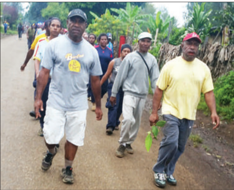
Ol polis bilong Isten Hailans i ekseais long rot long redi long 2017 ilekseen.

Long taim PPC Ndrasel i kisim ki bilong ol dispela kar, em i mekim tok promis olsem bai ol i yusim ol kar long mekim wok bilong lukautim lo na oda insait long provins.