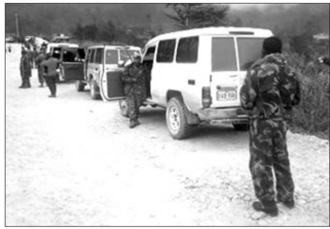
Ol polis i wok i stap long Hela Provins.