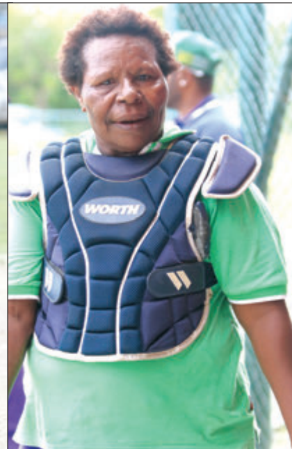
Ketsa bilong Wantok i kisim win.