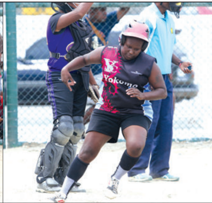
Rana bilong Yokomo i kam hom wantaim stail.