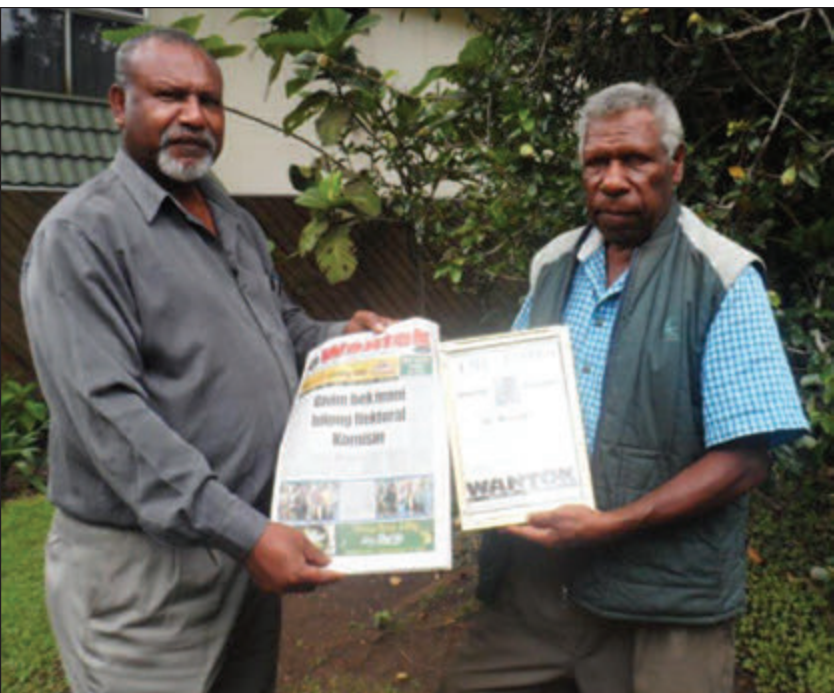
Sape wantaim Wilson husat i strongim Wantok Niuspepa long Goroka.

Dispela ol lain i bin mekim gutpela pasin bilong wokbung na ol i bin ranim gut kampani.