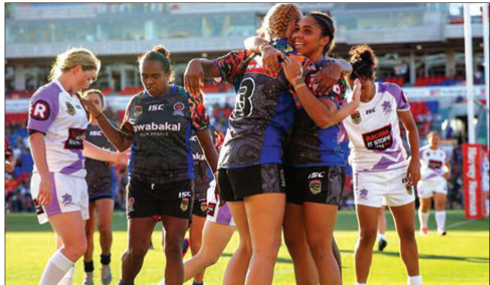
Ol Indigenous All Star meri i bin amamas na holim pas bihain long ol i daunim ol World All Star meri long namba wan taim.

INDIGENOUS All Stars tim bilong ol meri i daunim ol World All Stars meri tim long namba wan taim wantaim bikpela poin, 14-4, long McDonald Jones Stediam long las wik Fraide.