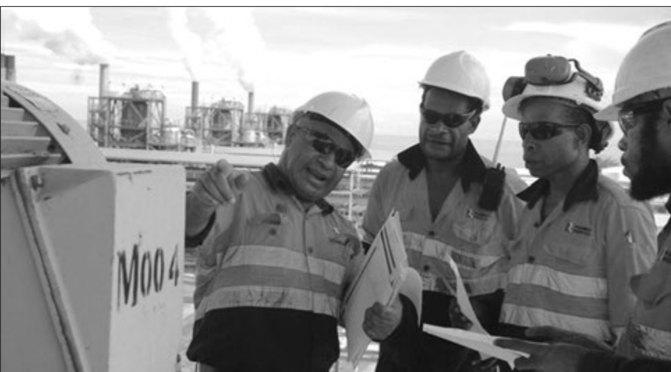
BSK Refaineri Prosesing Treina, Kamas Nisarap i givim salens long ol opereta long save gut long ol prosesing sistem long Laimston Krasing Plen.