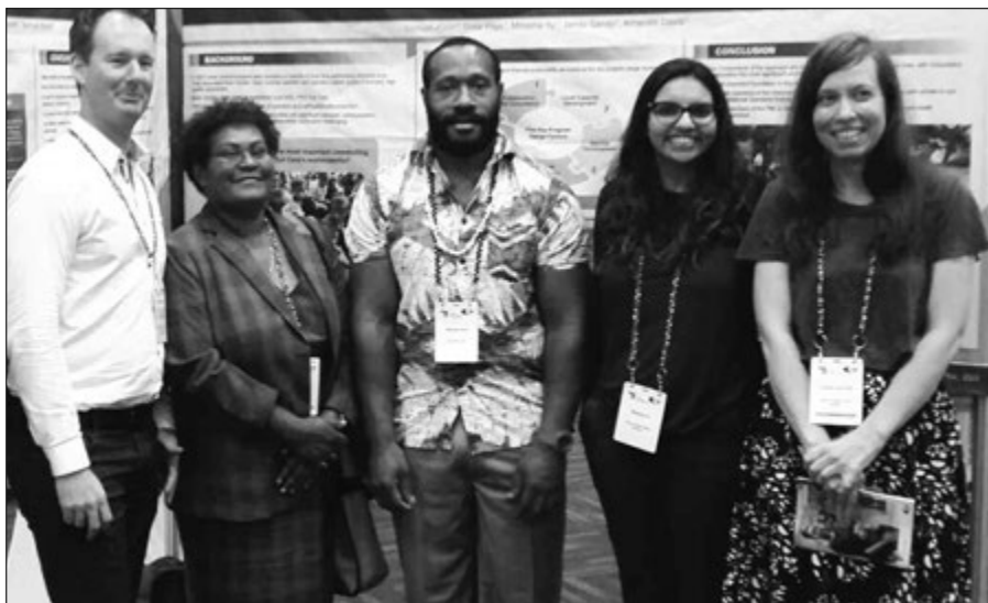
gren i kam long faundesesen long em. kisim awot long han bilong ol yet

Namel long ol 24 wina long wol, tupela bilong ol i bin kisim ol travel