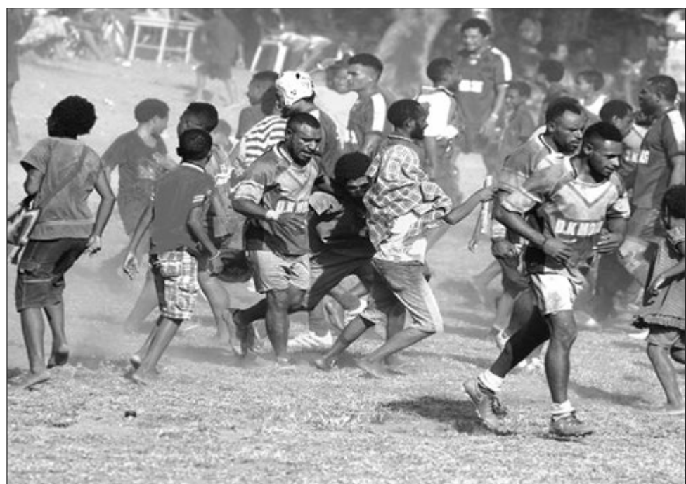
Pait i kamap namel long ol sapota na pilaia bilong tupela tim, Aroma Coast West na Goilala Karuka, na olgeta pilai na sapota i ran i go kam long olgeta hap bilong pilai graun.

Ol Koiari Osis i bin daunim ol Marshall Laggon Sentrel, 6-4, na i pinisim namba tri ples long anda-20 divisen.