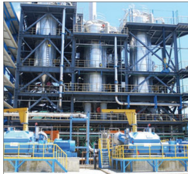
Bikpela hai presa esid litsing plent bilong Ramu Nickel Projek long Basamuk Rifaineri long Madang.

kampani bilong Amerika long wanpela join vensa agrimen long developmen bilong Star Maunten kopa/gol projek long Westen provins. Dispela eria i stap klostu long bikpela Ok Tedi projek long Star Maunten.