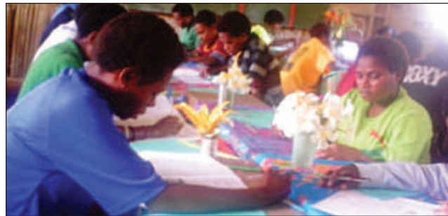
Ol gret 8 sumatin bilong Mopo praimereri skul long Sumao-Garia eria long Begesin long Madang provins i sindaun long gret 8 eksam.

Mopo praimereri skul em i wanpela rurel praimereri skul long wod 19 long Usino LLG long Usino-Bundi distrik long Madang provins. Ol rurel sumatin save givim