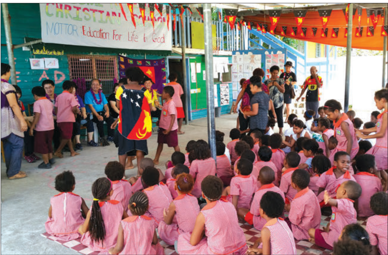
Ol sumatin na tisa i bungim ol sponsa bilong Korea.

Pot Mosbi Rainbow Kristen Skul we Mista Bai i lukautim bai kamap fokol poin bilong trenim ol lokal pipel long kamap tisa bilong ol elementri skul long ples bilong em bikos ol tisa i hat long go long ples bilong em. Em i painim pinis tupela man long trenim ol long neks wik.