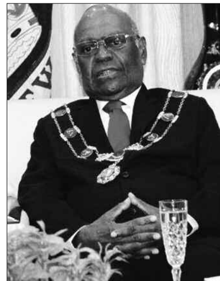
Gavana Jeneral Gren Sif Sir Michael Ogio

Opis bilong Gavana Jeneral i tok tenkyu long ol pipel bi-