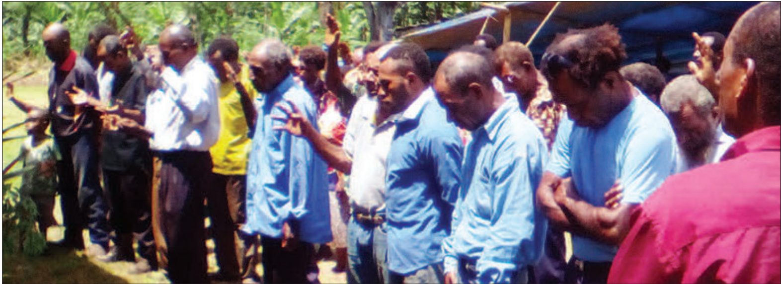
Ol lokal lida long Daunagari i daunim het long beten long kruseid.