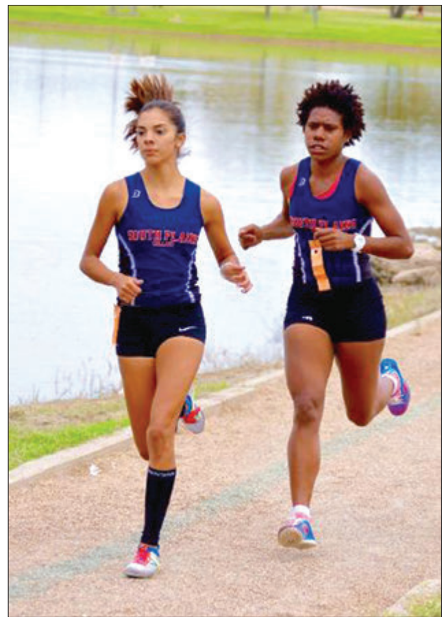
Poro Gahekava long han sut na poro pilaia bilong em i traime resis.

MP Duban, husat i bin stap long lukim dispela gren fainal i tokaut long ol ragbi lig sapota na ol manmeri husat i bin bung long lukim fainal olsem em bai go het long sapotim ragbi lig long Madang taim em i stap olsem memba bilong distrik.