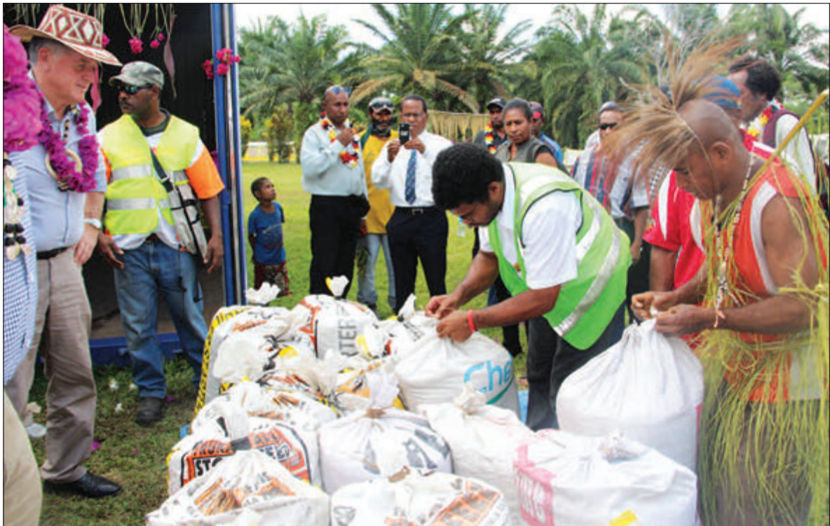
Trukai Industries i baim 6-pela tan bilong rais pedi long ol Rais Groas Kopretiv Grup long Oro Provins long las yia.

long ol asples fama husat i save planim rais na givim mani long ol long helpim famili na sindaun bilong ol.