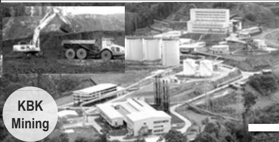
135 KM Slurry Pipeline