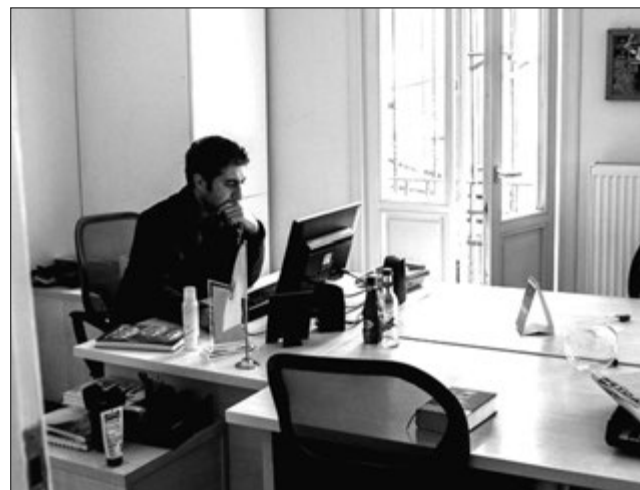
Wanpela wokman bilong pro-Kurdish DIHA nius ejensi long opis bilong em long Istanbul long 30 Oktoba.

Imejensi lo 675 i givim oda long pasim 10-pela niuspepa, tupela nius ejensi na tripela megasin. Dispela i mekim namba bilong ol nius ogenaisesen gavman i bin pasim i surik i go antap long 160. Planti bilong ol dispela nius ogenaisesen gavman i bin pasim long Sarere i gat hetkwata bilong ol i sap long saut is we moa Kurdish pipel i stap. “Ol polis i kam long 4 klok