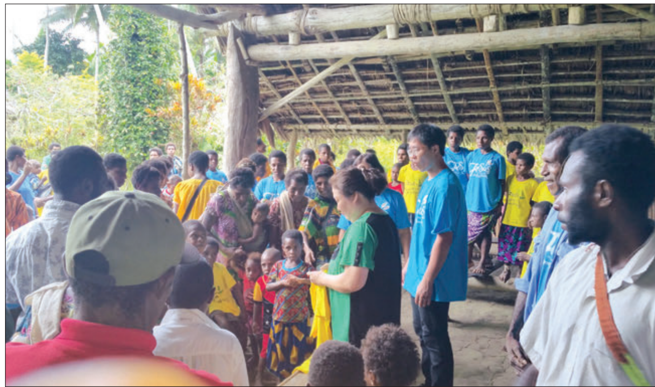
Ol sumatin wantaim ol komyuniti i sindaun wantaim ol misineri visita bilong Korea long harim toktok.