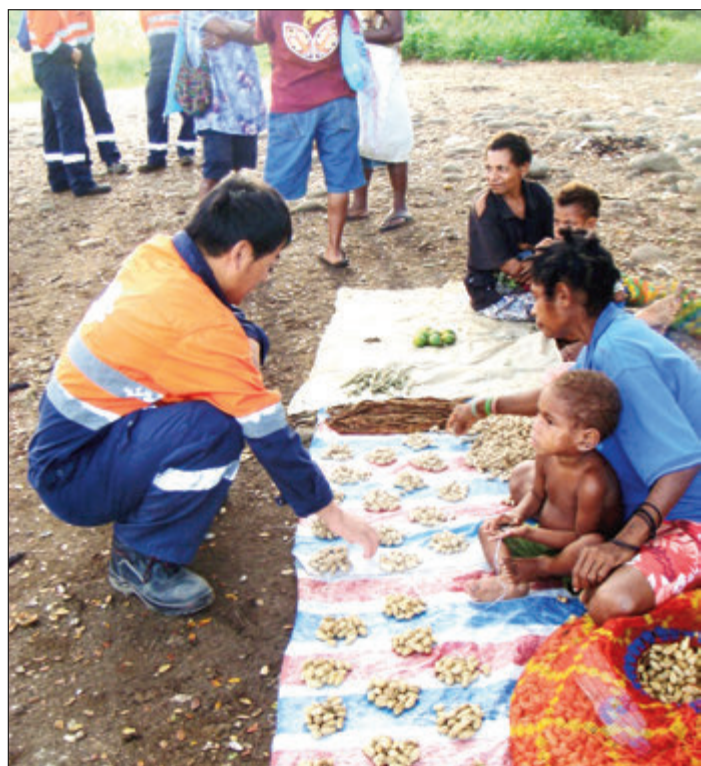
Wanpela kastoma go baim pinat long Wano wantaim mama bilong em.

Wanpela bikpela hip o grup pinat em 10 toea tasol.