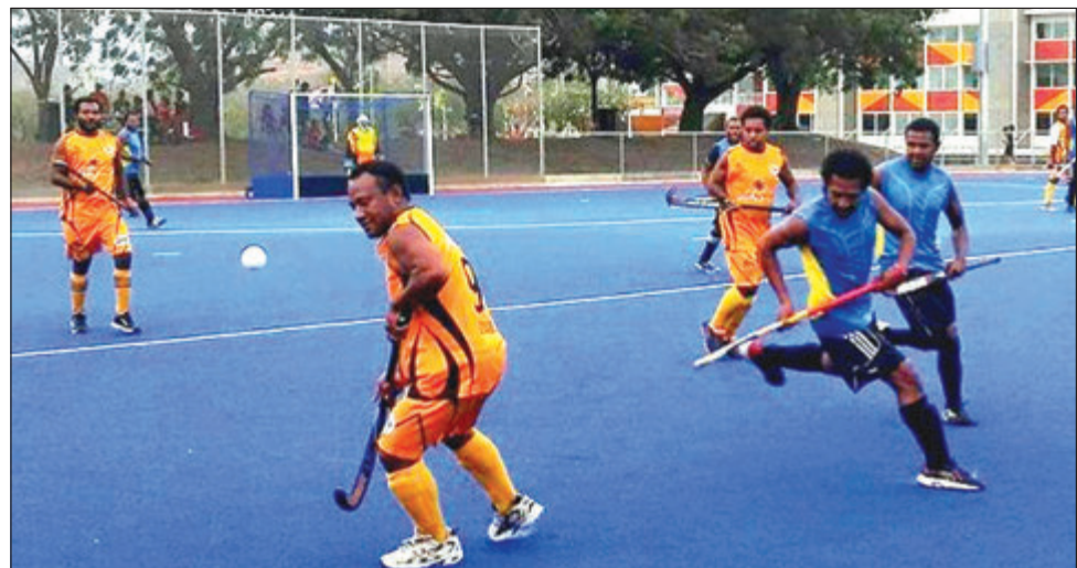
Ol Sunam wantaim yelo uniform i daunim ol Bladez, 2-0.

Hoki Asosiesen i kisim malolo long sotpela taim long larim ol wok redi bilong FIFA Anda 20 Wol Kap resis bilong ol meri i ken kam long mak bipo long ol i mekim plen bilong tonamen bai kamap long krismas.