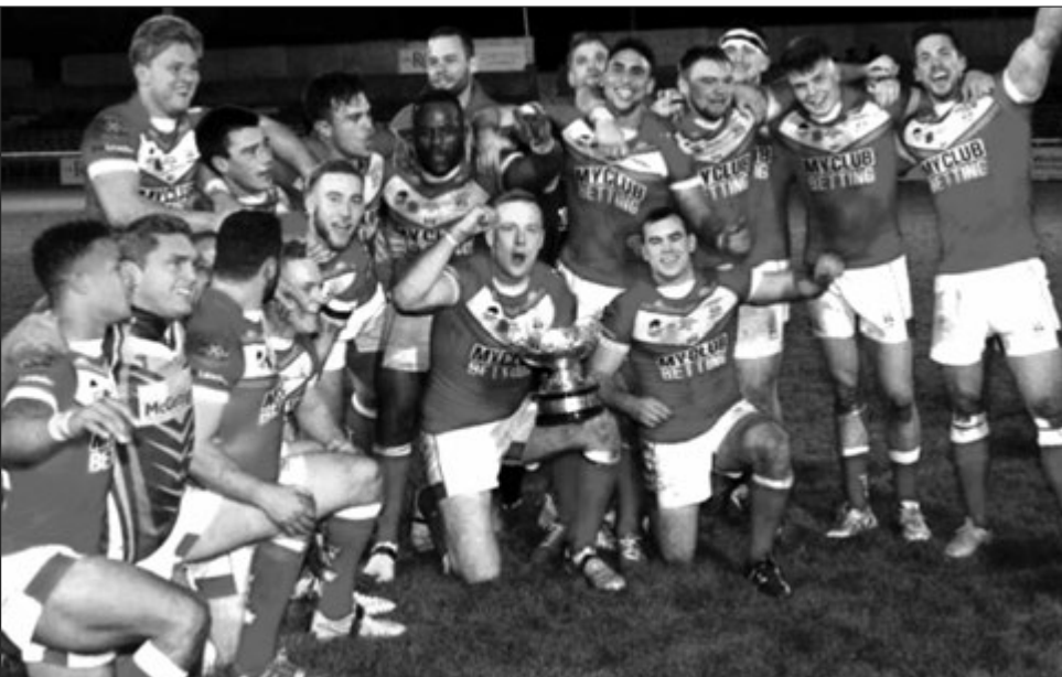
Ol Wales i amamas long ol i bin win long Yuropien Kwalifaing na nau ol i redi long Ragbi Lig Wol Kap 2017 resis bilong ol man bai kamap long yia i kam.

IRELAND na Wales bai resis long Ragbi Lig Wol Kap 2017 (RLWC2017) bihain long tupela kantri wantaim i topim long wan wan Ragbi Lig Yuropien Federesen (RLEF) kwalifaing grup bilong ol.