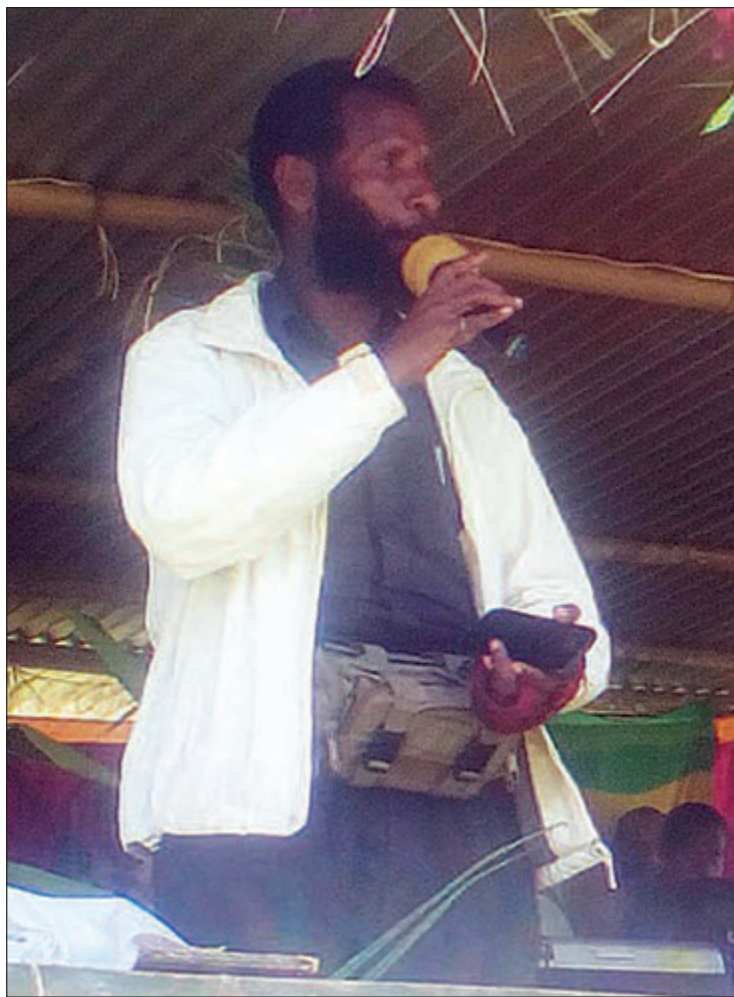
Wanpela pasto i serim tok bilong God long kruseid.