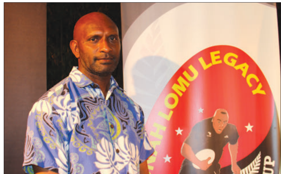
Wanpela olupela pilaia bilong PNG Pukpuk husat klostu long pilai egensim Jonah Lomu.