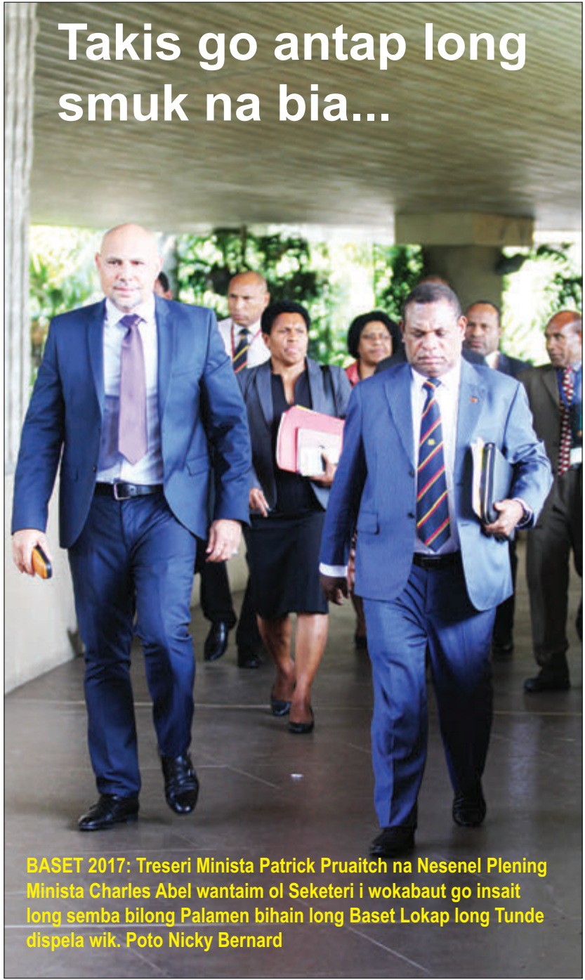
BASET 2017: Treseri Minista Patrick Pruaitch na Nesenel Plening Minista Charles Abel wantaim ol Seketeri i wokabout go insait long semba bilong Palamen bihain long Baset Lokap long Tunde dispela wik.