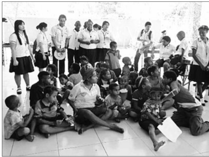
Ol liklik pikinini na ol Sen Joseph Katolik Koles sumatin husat i bin givim taim long skulim ol Strit Ministri pikinini.