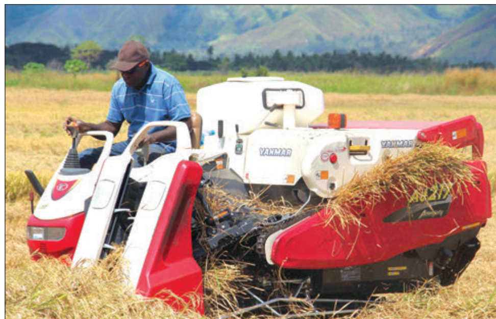
Wanpela masin ol i kolim rais havesta i pikim rais long Chingwam long Makham Veli, Morobe Provins.

Sais bilong dispela 7 hekta em i olsem 7-pela ragbi fil.