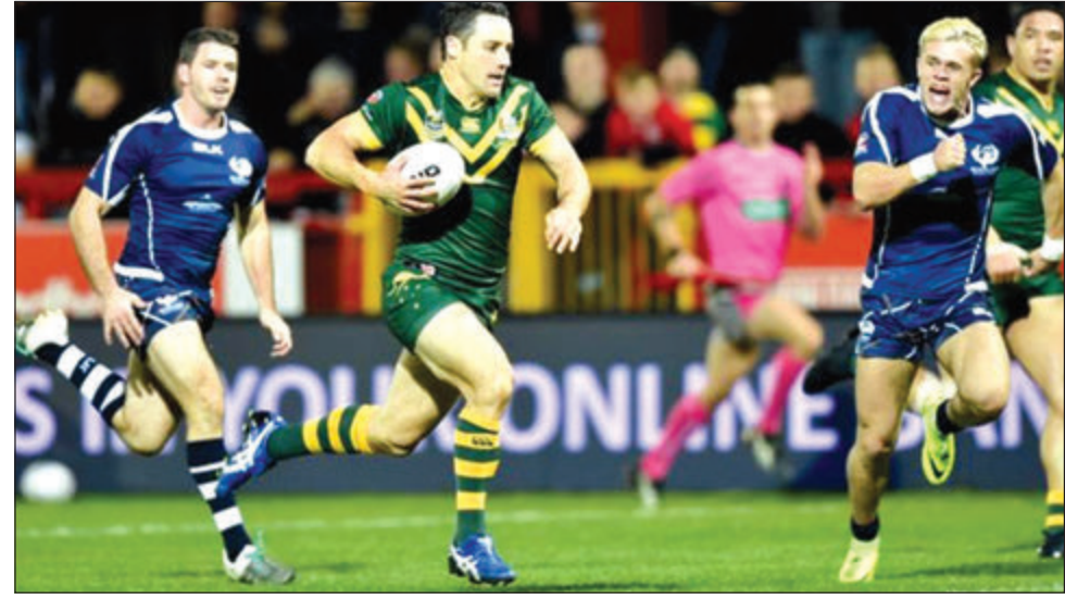
Cooper Cronk bilong Australia i ran i go long putim namba tu trai bilong em long namba wan hap bilong resis.

Long Fraide, 11 Novemba, 2016, Nu Silan bai salensim Skotland na Ingran bai salensim Australia long Sande, 13 Novemba, 2016, long wik bihain.