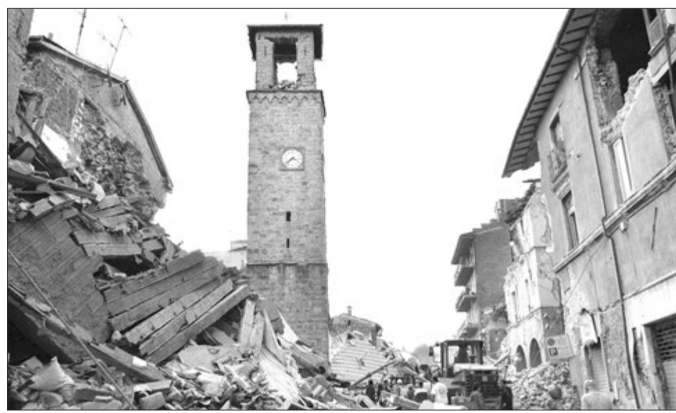
Klok long 16 senturi bel taua i stop long 3.36am long taim guria i kamap long Amatrice.

PRAIM Minista Matteo Renzi bilong Itali i tok kantri i mas stretim gen ol taun na viles long Sentrl Itali em bikpela guria inap long mak bilong 6.6 i bin bagarapim long Sande moning.