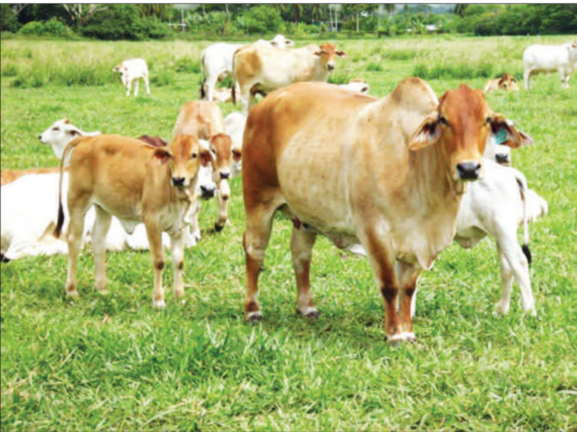
Buluma kau bilong Trukai Industries long Erap Fam ausait long Lae, Morobe Provins.

“Rais em i namba wan bisnis bilong Trukai, tasol nupela divelopen long planim arapela kaikai na lukautim bulmakau, em i kamap nupela pasin bilong Trukai long helpim ol asples manmeri long PNG.”