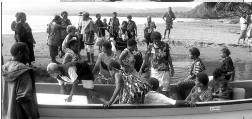
Moto bot bilong ol Kostal Paiplain mama ran gut.