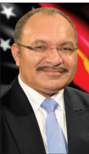
Praim Minista Peter O'Neill.

PRAIM Minista Peter O'Neill i tok PNG i opim dua long mekim bisnis taim gavman i apim han long holim bikpela bung bilong ol lida bilong APEC long 2018.