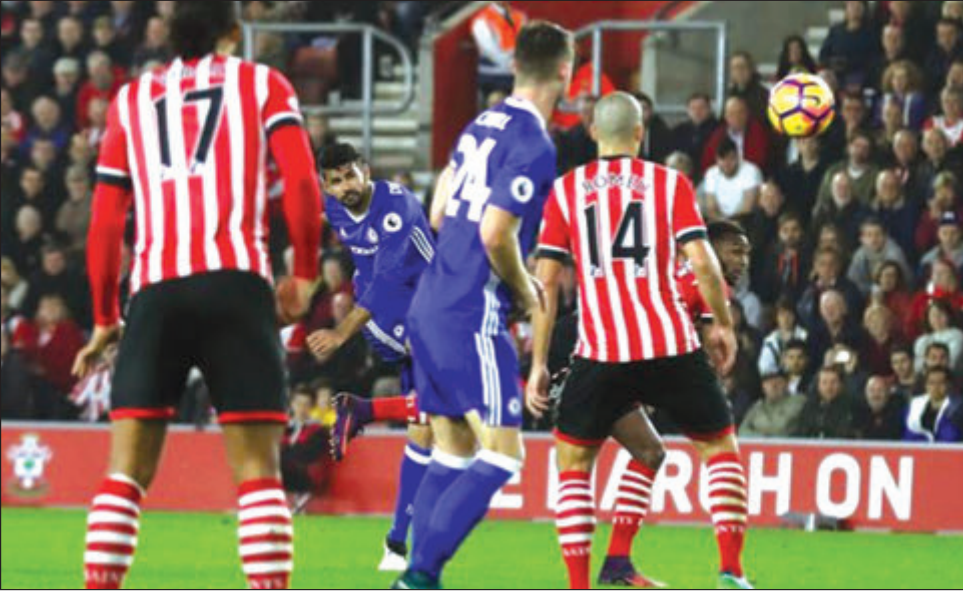
Kepten bilong ol Chelsea, Diego Costa, i putim wangepela gol egensim ol Southampton em i namba 19 gol bilong em inap long 11 Premia Lig gem.

Dispela win em i namba foa taim bilong ol Chelsea long win long dispela lig resis.