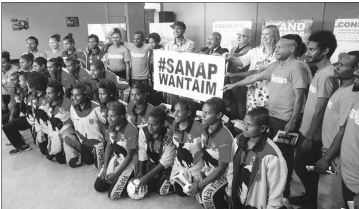
Meri anda 20 Nesenel soka tim i saptim SANAP WANTAIM kempen.

Mis Gabong, PNG U20 Wimen Nesenal Tim Kepten i tok, "mipela