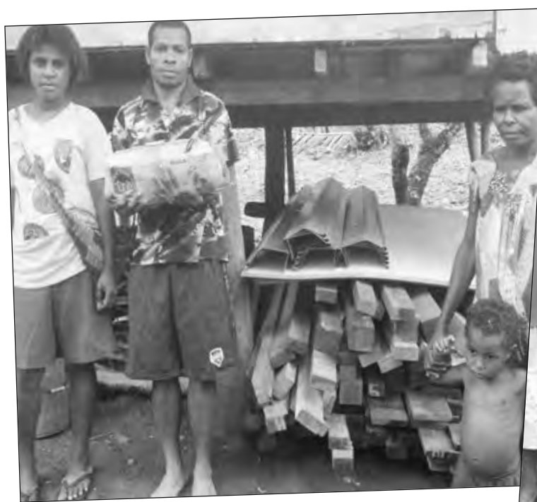
Ol asples lain husait i kisim ol donesin.