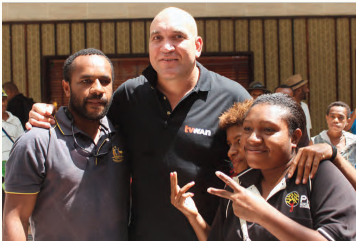
GORDON TALLIS LONG PNG: Biknem ragbi lig pilaia bilong Queensland Maroons na Brisbane Broncos i bin raun long Visen Siti long Pot Mosbi. Ol manmeri husat i bin stap long hap i bin kirap nogut na amamas long kisim poto na toktok wantaim em. Digicel i go pas long raun bilong dispela biknem man.