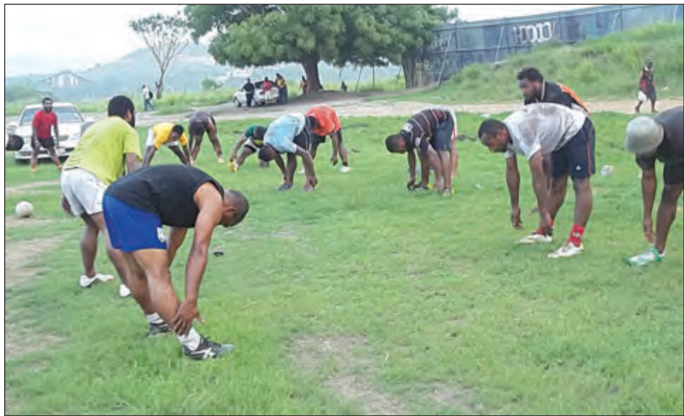
Ol Pom Diwai i trening long Kone Tiger Fil.

“Wanem tim i stap long namba wan ples bai go pilai long fainels. Raun robin salens bai no gat semi-fainel nabaut,” Mista Koke i tok.