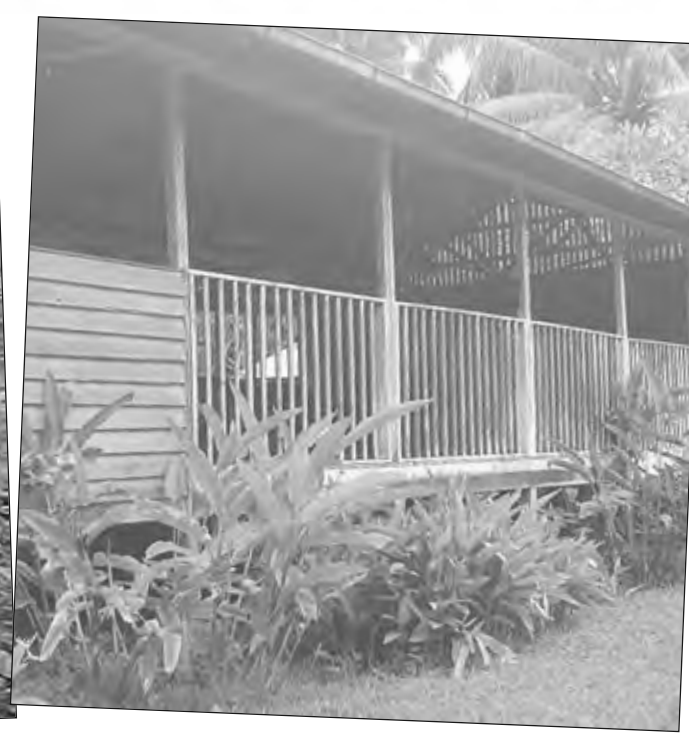
Sait bilong olpela sios we i sting nau.