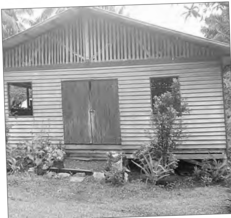
Olpela sios we ol bai senesim.