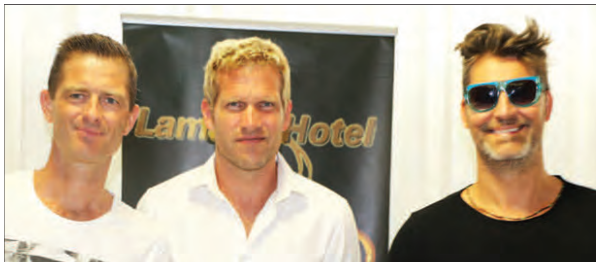
MLTR ben memba long taim bilong Pres kon-prens long Lamana las wik.