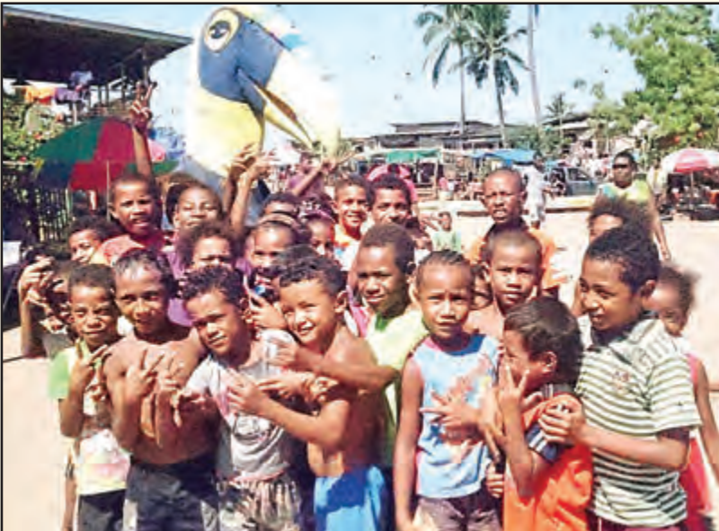
TURA: Tura Kokomo i amamas wantaim ol pikinini bilong Tatana long Nesenel Kapital Distrik (NCD).