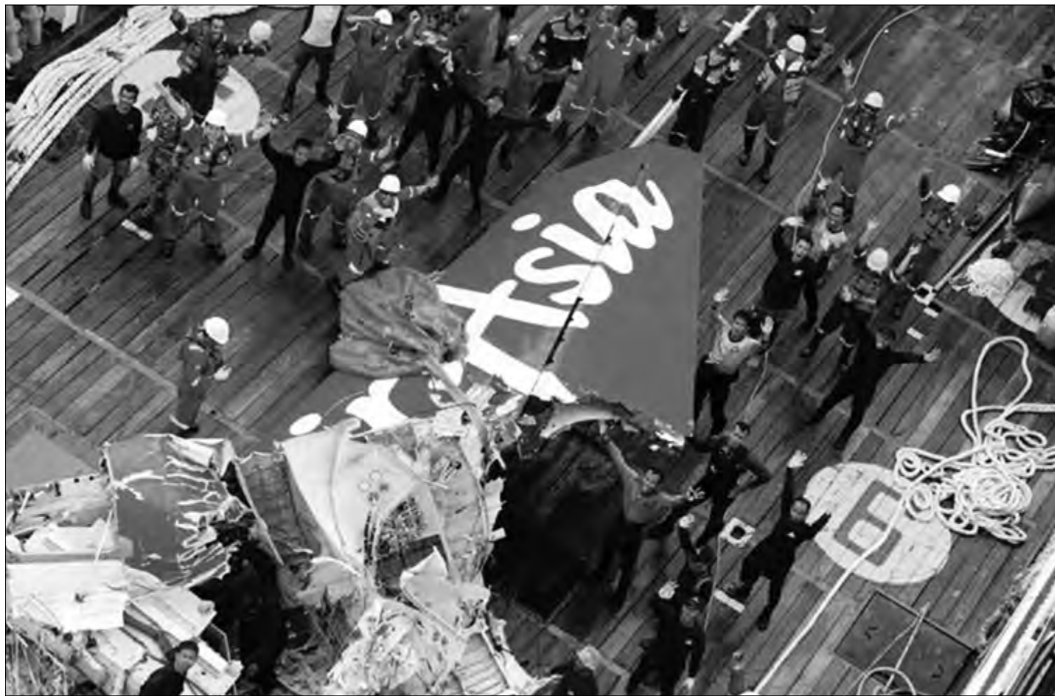
BLEKPELA BOKIS: Ol daiva i painim blekpele bokis long AirAsia we i bin kres na bagarap long Disemba 28, 2014, na planti i amamas olsem poto i soim.

Tok Pisin Service 6am - 7am 6080; 7240(KHZ) 7pm - 9pm 5995; 6020; 9710; 1280(KHZ)