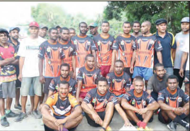
LAPWING TIGERS: Ol mangi bilong Lapwing Drive long Gordons long Pot Mosbi i redi long pilai long tas ragbi kompetisen long Gordons.