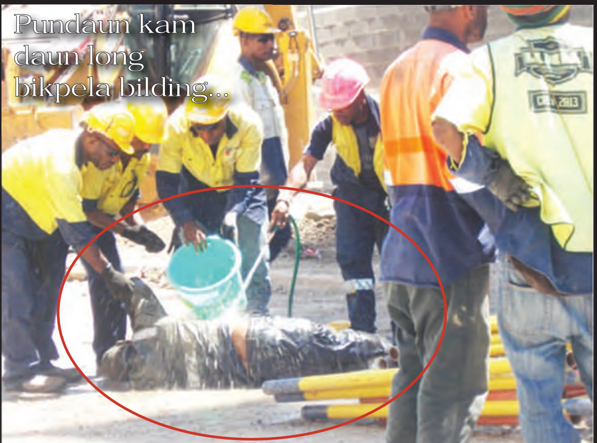
Poto hia i soim ol wokman bilong wanpela konstraksen kampani i traिम long helpim wokporo bilong ol husat i pundaun i kam daun long bikpela bilding ol i wok long en long Waigani...Man hia i kisim bikpela bagarap na slip long haus sik nau. Lukim moa stori long pes 2.