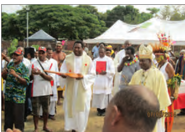
Prosesio bilong wokim lotu long opim nupela Sen Charles haus lotu bilding long June las yia.

Em i bilong kantri Australia tasol i wok long PNG long sampela yia nau, moa yet long Bereina na Mekeo eria, Sentral