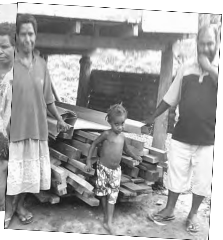
Mista na Misis Aimai wantaim pikinini blo tupela sanap wantaim ol donesin.

dispela helivim bai lukim nupela haus bai kamap na tu dispela donesin em i kam olsem wanpela bikpela Niu Yia presen.