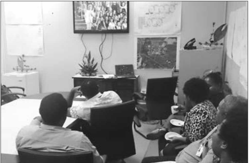
Ol sampela opisa bilong GOC i lukim Komonwelt Gems long TV na kisim samting gutpela tingting.

Long dispela taim nau, ol opisa bilong GOC i wok strong yet long lukim olsem olgeta samting i redi.