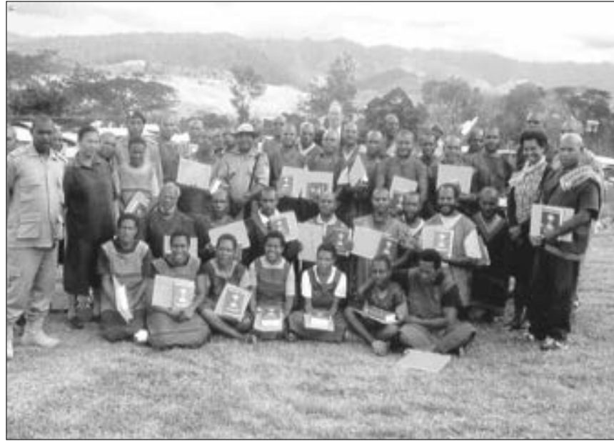
Kalabus lain greduet.. Ol Kalabus lain long Bihute banis kalabus long Goroka Isten Hailans i sanap wantaim ol CS opisa na patna bilong em na kisim poto bihain long kalabus lain i greduet na kisim setifiket long literesi skul.

Dispela em i namba tu literesi greduesen bilong ol man na meri. Namba wan greduesen i bin kamap long 2013 yia i go pinis we moa long fifti (50) literesi sumatin i bin greduet long wankain pasin we i kamap long dispela namba tu greduesen.