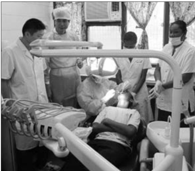
DENTEL OPERESEN: Ol visiting Guandung Saina dentis dokta i wokim operesen wantaim helpim bilong ol PNG dentis na nes long Dentel Klinik, long Pot Mosbi Jenerel Haus sik, 3 Mail.