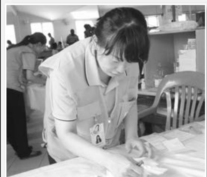
FAMASI: Famasi o kemis seksen bilong ol tu i bin bisi we ol dokta i wok long sekim, redim na givim ol marasin i go long pipel long ol kain kain sik we ol dokta i bin lukim ol na raitim long kisim long famasi bilong ol yet.