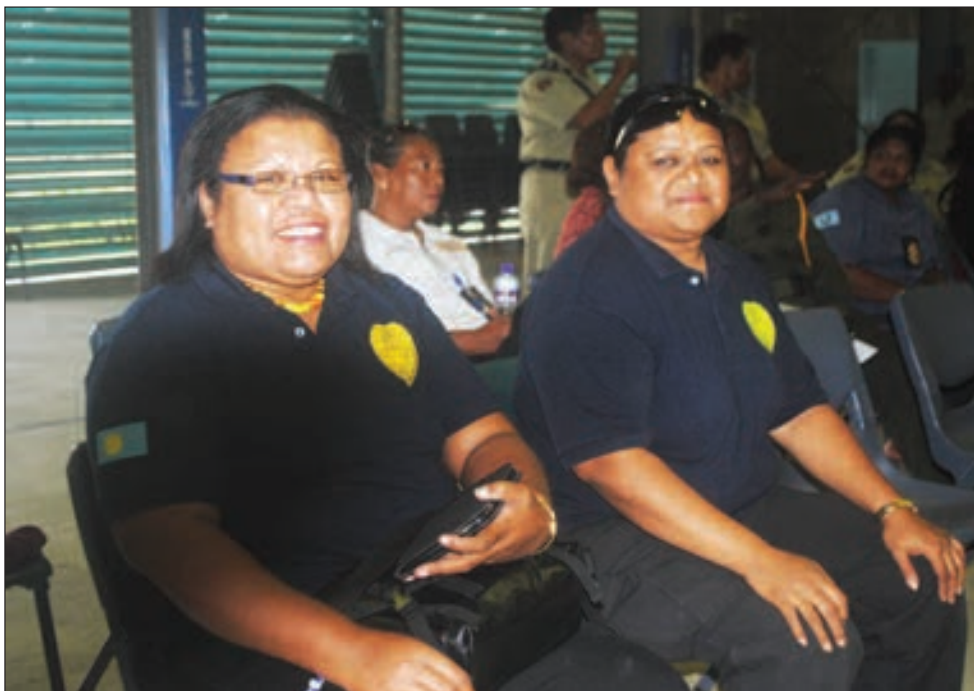
Ol Koreksenal Opisa bilong ol Pasifik Ailan i kam bung long Pot Mosbi.