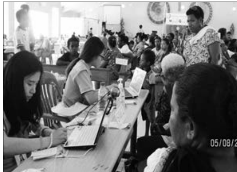
SEKIM: Ol Saut Korea volantia dokta i sekim ol manmeri na pikinini i gat sampela sik long bodi bilong ol. Samting olsem 38 dokta na nes i bin givim fri medikel sevis long wanpela wik las wik long Caritas Gels Teknikel na Sekenderi skul.