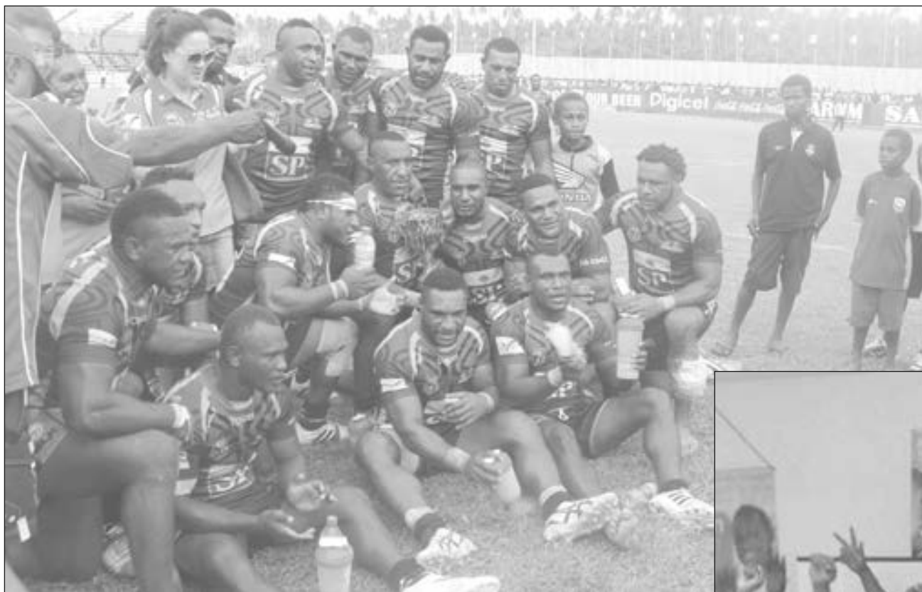
Ol Hunters i singim tim song bilong ol bihain long ol i winim Jets 42-22 long Kalabond.

Tenk yu tru na lukim yu long neks wik gen