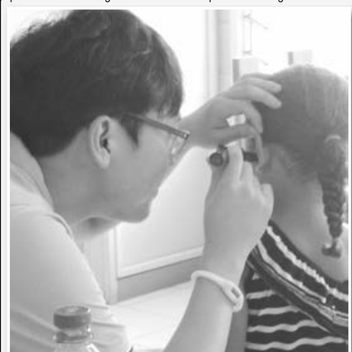
SEKIM: Dokta i sekim yau bilong wanpela liklik gel husat i gat sik long dispela eria.