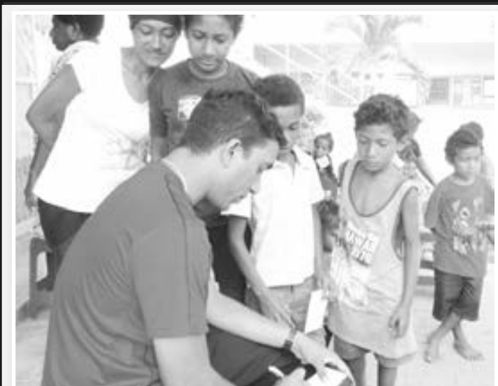
NAMBA WAN STEP: Namba wan ples ol manmeri na pikinini i go long givim nem, askim wanem kain sik na sekim weit o hevi bilong ol taim ol i laik kisim sevis long ol volantia dokta bilong Korea. Hia em wanpela pater wokman bilong Caritas i sekim wanpela liklik mangi.

Ol poto i soim ol Volantia Dokta na nes bilong Saut Korea husat i bin givim fri hai kwaliti helt sevis long wanpela wik las wik long Caritas Gels Teknikel Sekenderi skul, Mosbi.