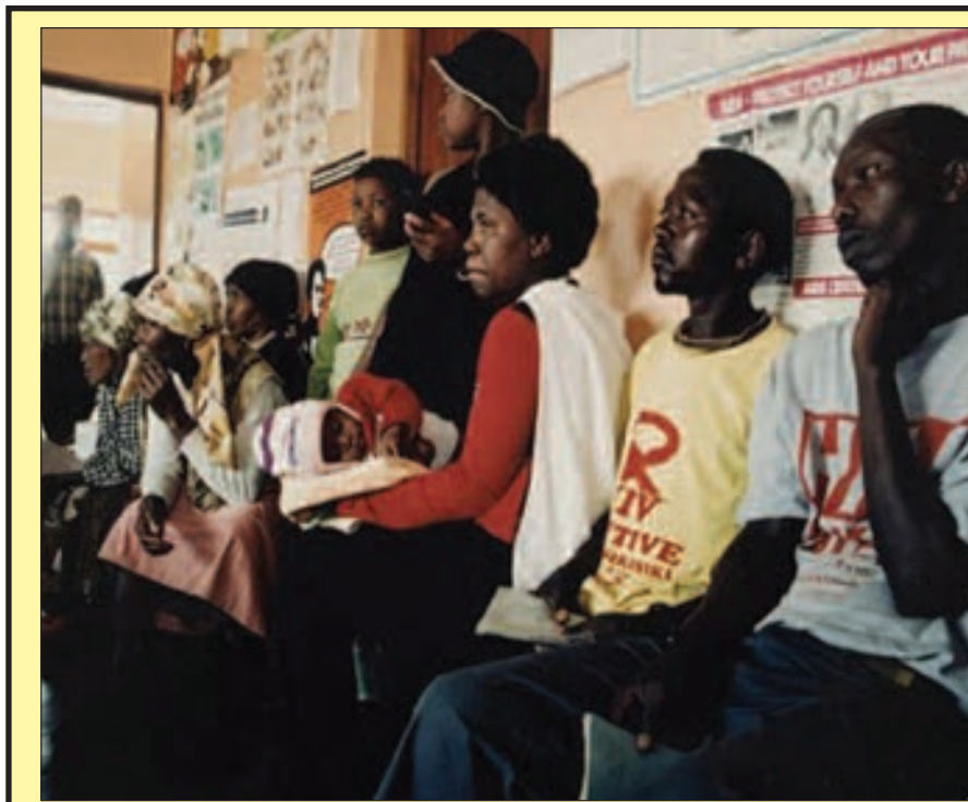
South African AIDS Klinik

Masta plen bai pinis long Me 2015 na disain bilong wanem kain haus em bai pinis long namel bilong 2016 na konstraksen bilong nupela ANGAU Haus sik bai pinis long stat bilong 2017.