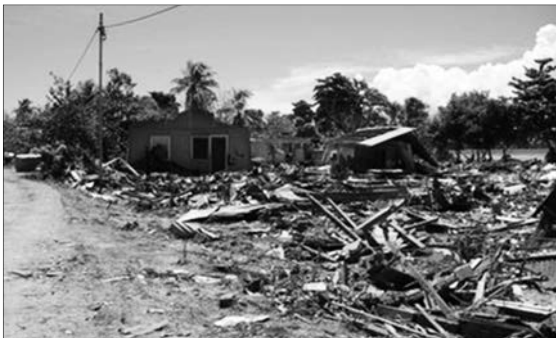
Redio Australia i save kisim ol ripot na nius long olgeta hap bilong Pasifik, olsem long poto hia em sunami bilong 2007 long Westen Solomon.