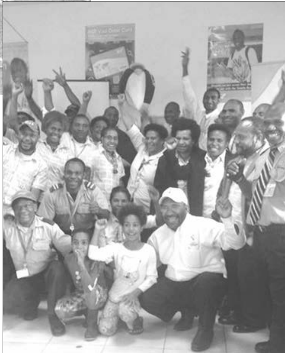
Tura wantaim ol wok manmeri bilong BSP long Enga Provins

Gavana Ipatas i tok olgeta provins insait long kantri i mas sapotim raun bilong Tura, long wanem, sapot bi- long ol provins bai helpim long kamapim gutpela Pasi- fik Gems long neks yia.