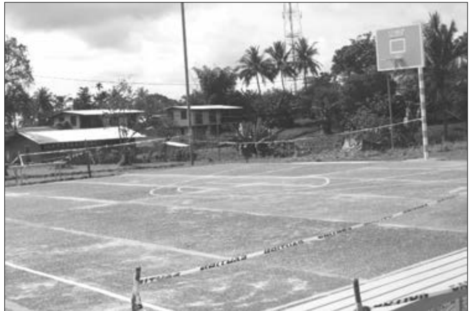
Basketbal kot long Kiunga Vokesenel Skul.

“Spot em i wanpela gutpela samting long helpim ol yangpela long kamap ol gutpela manmeri insait long ol komyuniti, na BSP i amamas long givim sapat na helpim ol komyuniti long spot,” Mista Thornton i tok.