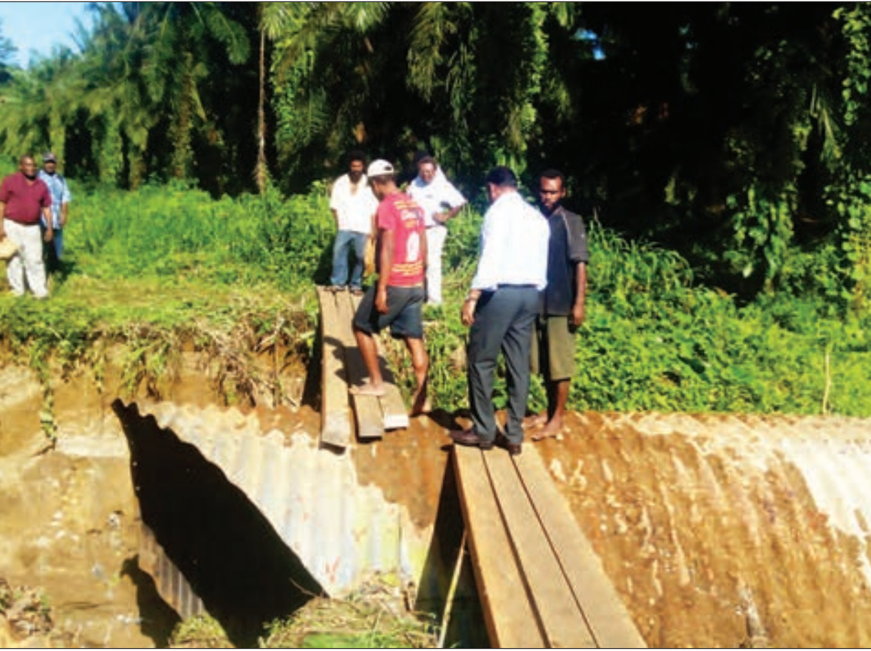
Piksa bilong bris i bruk na ol i putim timba long wokabout i go hapsait.

Sitapai i wok long kodinetim wok wantaim NBPOL na SBLC long putim wanpela bai pas bris long sotpela taim na bai helpim ol lain long go i kam pastaim.