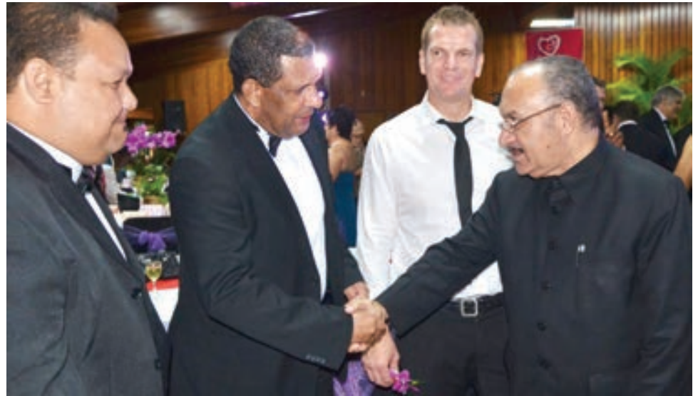
Praim Minista Peter O'Neill i sekan wantaim wanpela bikman long dina nait i bin kamap long las wiken long Palamen Stet Fansen Rum we em bin givim mani i go long Okid Sosaiti bilong PNG.