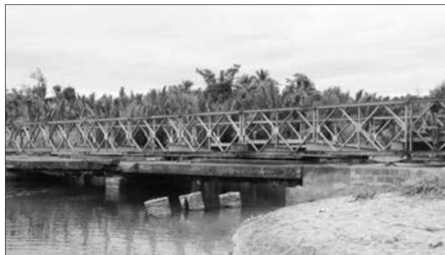
Pukpuk bris long bipo (antap), na Pukpuk bris long nau (daunbilo).