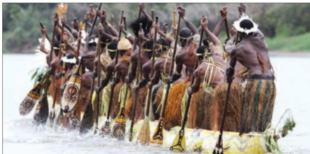
Tupela longpela woa kanu i resis long bikipela wara long ples Kewa long Midel Flai Distrik. Dispela ol longpela kanu i ken karim moa long 80 man na sapos 80 man i pul em ken winim spit bilong 15 hos paw moto bot.