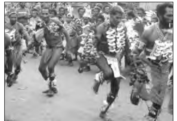
DANIS LONG SOIM AMAMAS: Ol man Murik Leiks i singsing bihain long welkam.