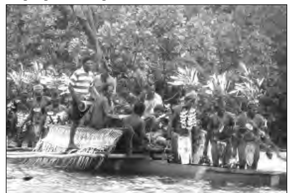
KANU SUA: Sel kanu i seil i go sua long Bikpela Murik Leik viles.