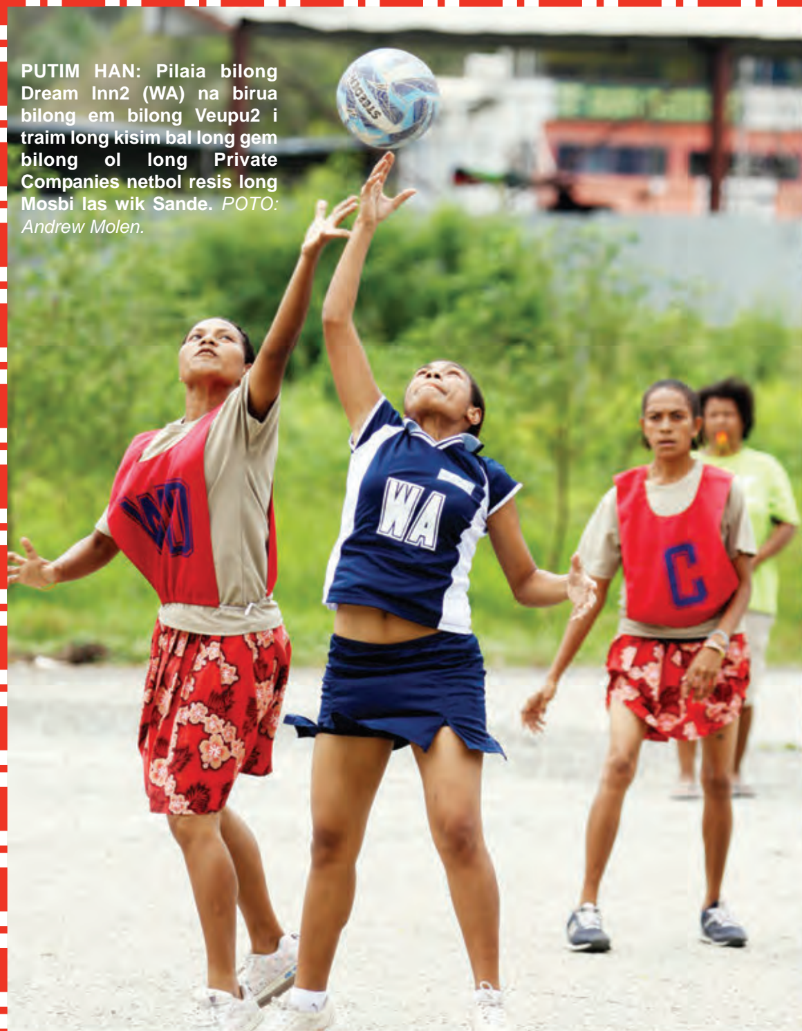
PUTIM HAN: Pilaia bilong Dream Inn2 (WA) na birua bilong em bilong Veupu2 i traिम long kisim bal long gem bilong ol long Private Companies netbol resis long Mosbi las wik Sande.