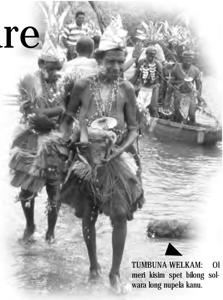
TUMBUNA WELKAM: Ol meri kisim spet bilong solwara long nupela kanu.