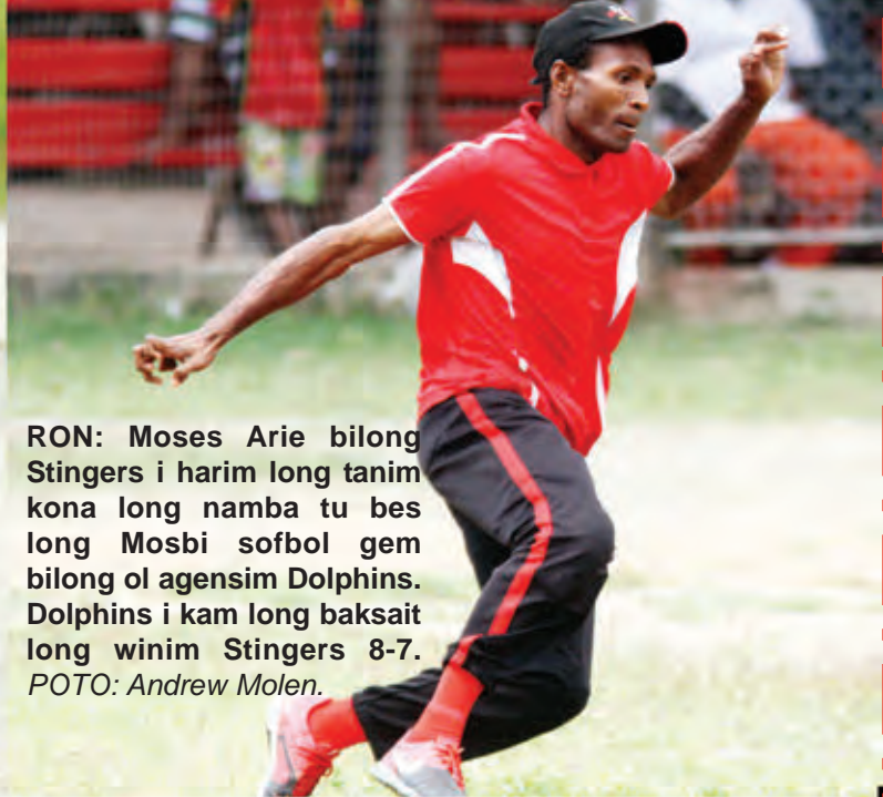
RON: Moses Arie bilong Stingers i harim long tanim kona long namba tu bes long Mosbi sofbol gem bilong ol agensim Dolphins. Dolphins i kam long baksait long winim Stingers 8-7.

TOKSAVE: Salim ol spots Dro bilong yu kam long Feks; 325 2579, e-mel; amolen@wantok.com.pg o kam lusim long Wantok Niuspepa opis long Central Waigani, NCD.