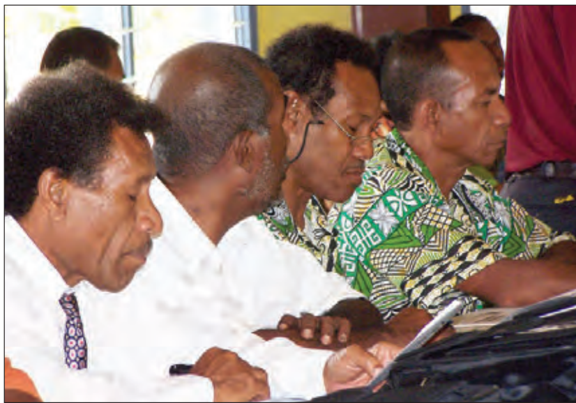
UC SIOS LIDA BUNG: Sampela ol bikman bilong Yunaitet Sios long wanpela bung bilong ol. Fail Poto

Reveren Lowa i bin tok yumi mas painim gutpela save na pasin i kam long God bilong helpim yumi i daunim ol kain hevi yumi bungim nau na long ol taim i kam.