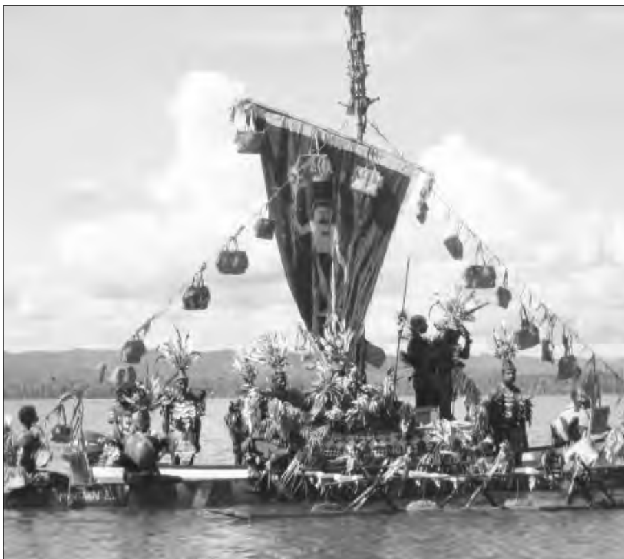
KANU SEIL: Kanu bilong Gren Sif Somare i sua long Wewak basis long las wik Fonde.