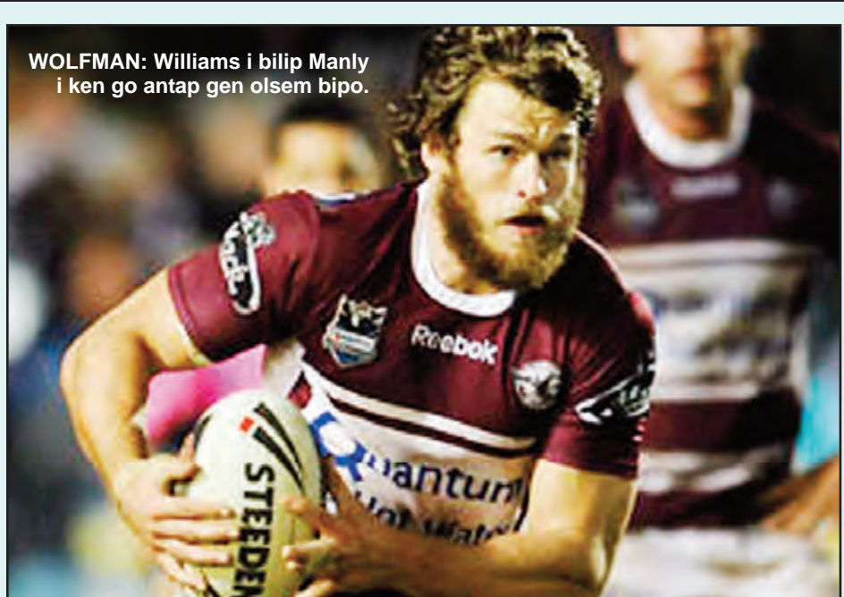
WOLFMAN: Williams i bilip Manly i ken go antap gen olsem bipo.

Hodges bai no inap stap insait long NRL All Stars gem long Februari na i no toktok tumas long wanem samting em i tingting long mekim dispela yia tasol Henjak na tim i bilip long em na i amamas olsem em i ken ron wantaim ol gen.