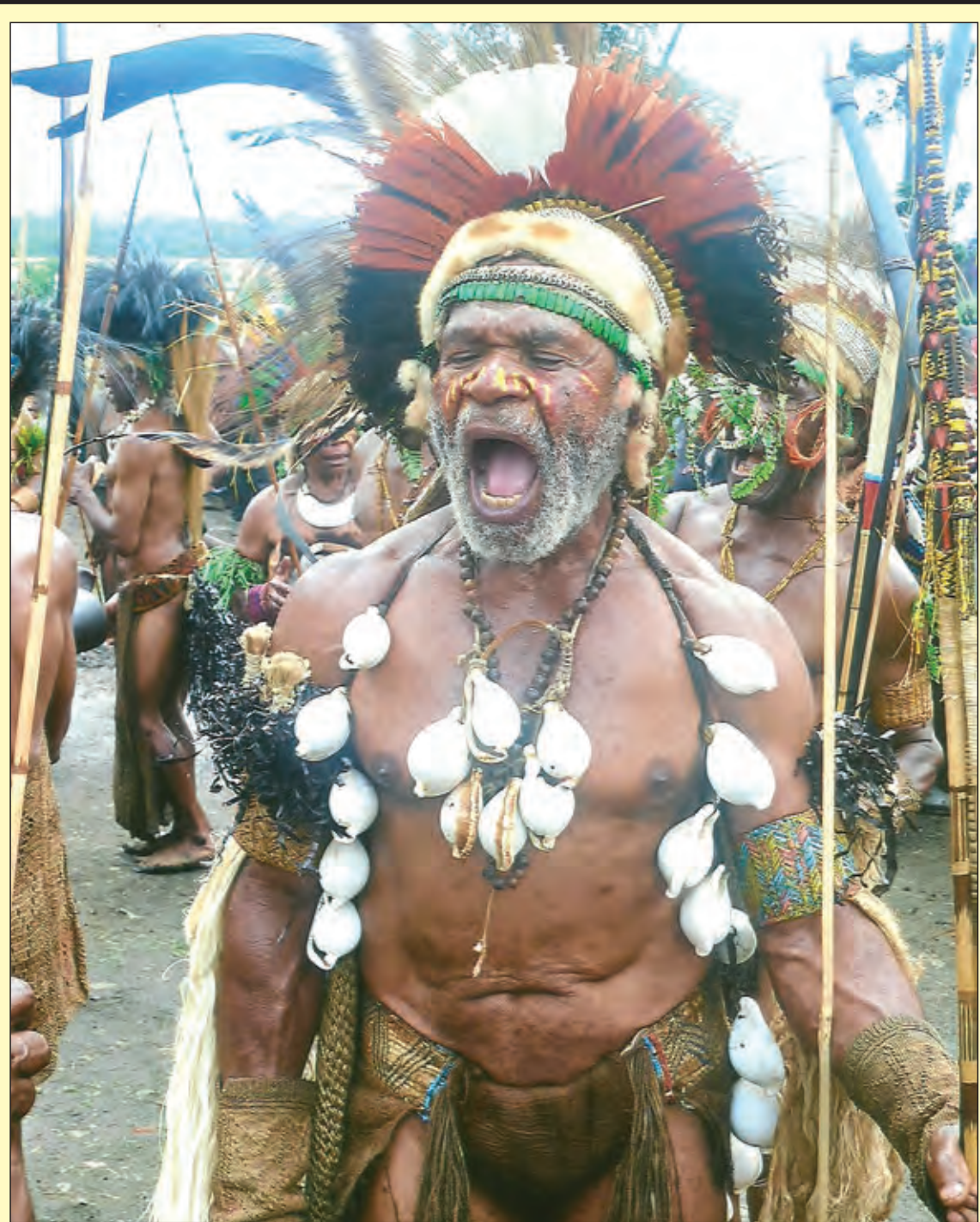
SINGAUT STRONG: Noken ting olsem em i man nating. Nogat. Em wanpela lidaman long ples Nameasaro hauslain long Unggai distrik long Isten Hailans husat i bin bilas tumbuna na kamap na kirapim das long singsing long taim bilong opisal lonsim bilong Unggai Bena distrik Kopi Koporetiv na Kopi Neseri projek long Goroka long wik i go pinis. (Moa stori long pes 4)

toktok long Ilektorel Komisin na Bogenvil Ilektorel opis long Buka.