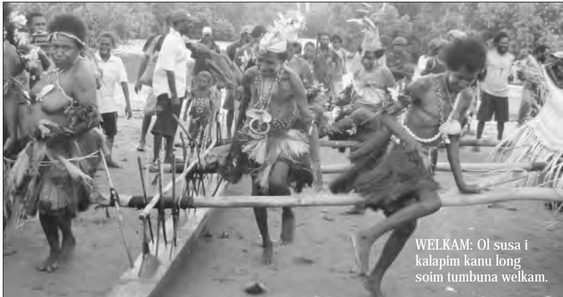
WELKAM: Ol susa i kalapim kanu long soim tumbuna welkam.