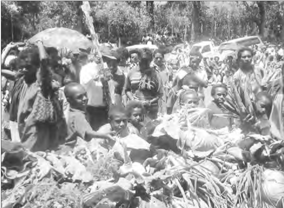
PASIN: Dispela em pasin bilong givim tenksgiving stret. Ol yangpela na mama bilong ol husat i bin kamap long tenksgiving seremoni we i bin kamap long Gehato Foaskwe sios long Gahuku eria long Goroka long Krismas i go pinis.

helpim ol wokman bilong sios husat i save sanp long gutpela taim na taim nogut long autim dispela gutnius. Na sapos tok bilong God i save helpim ol long gutpla pasin em gutpela long