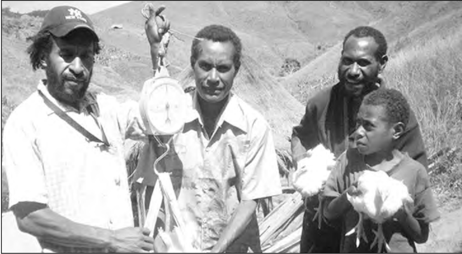
AMAMAS: Ol kakaruk fama bilong Komperi Veli i amamas na skelim kakaruk bilong ol bipo ol i salim.