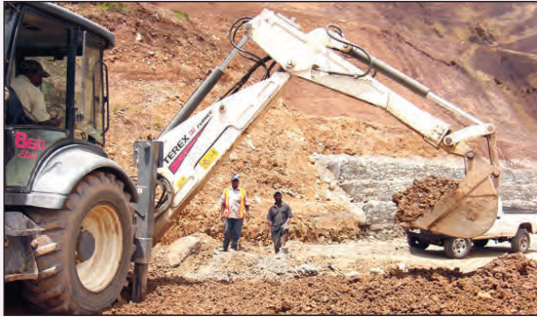
LAIKIM GUT-PELA ROT: Wok stretim long Daulo Pass, Isten Hailans.