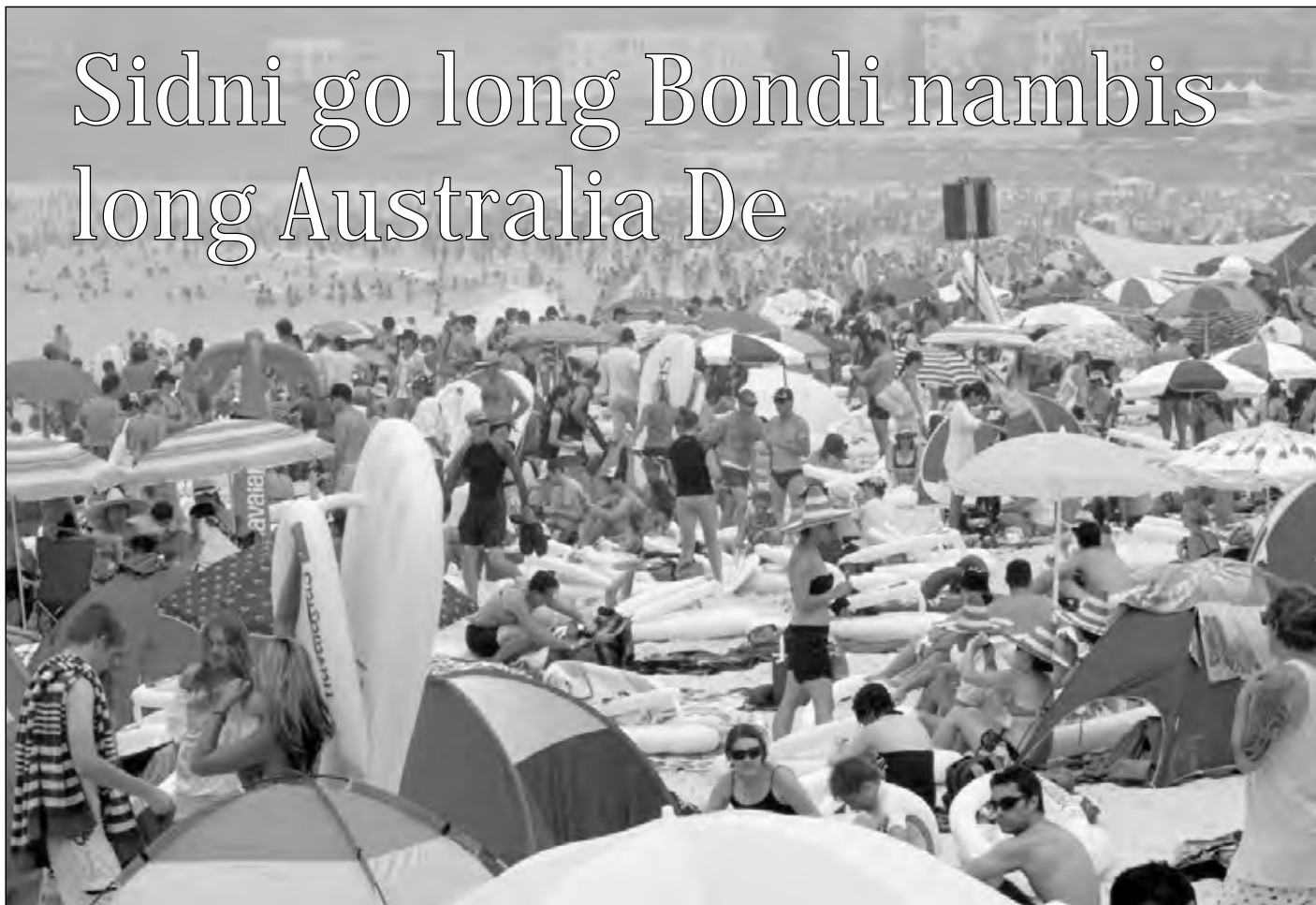
AUSTRALIA De, we em i pundaun aste, long namba 26 de bilong mun January, i bin lukim planti tausen manmeri bilong Sidni (Sydney) i brum i go daun long Bondai (Bondi) nambis long amamasim Australia De.

Sarere nait na pipel i save painim bodi bilong ol man, i bin painim sampela hap dai bodi tu long wanpela han wara klostu long Lowood.