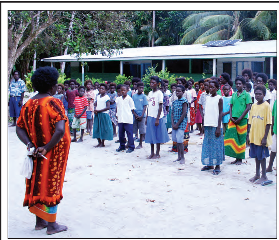
SKUL LONG KATERETS AILAN: Maski ol Katerets Ailan grup long Otonomes rijen bilong Bogenvil i stap long hevi, laip na wok i go olsem tasol olgeta de, olsem ol dispela skul sumatin husat bai redi gen long statim 2011 skul yia bihain long tripela wik. Fail Poto

Edukesen Dipatmen i mekim olsem long inapim gol bilong Yunivesel Besik Edukesen we PNG i mas inapim kam yia 2015.