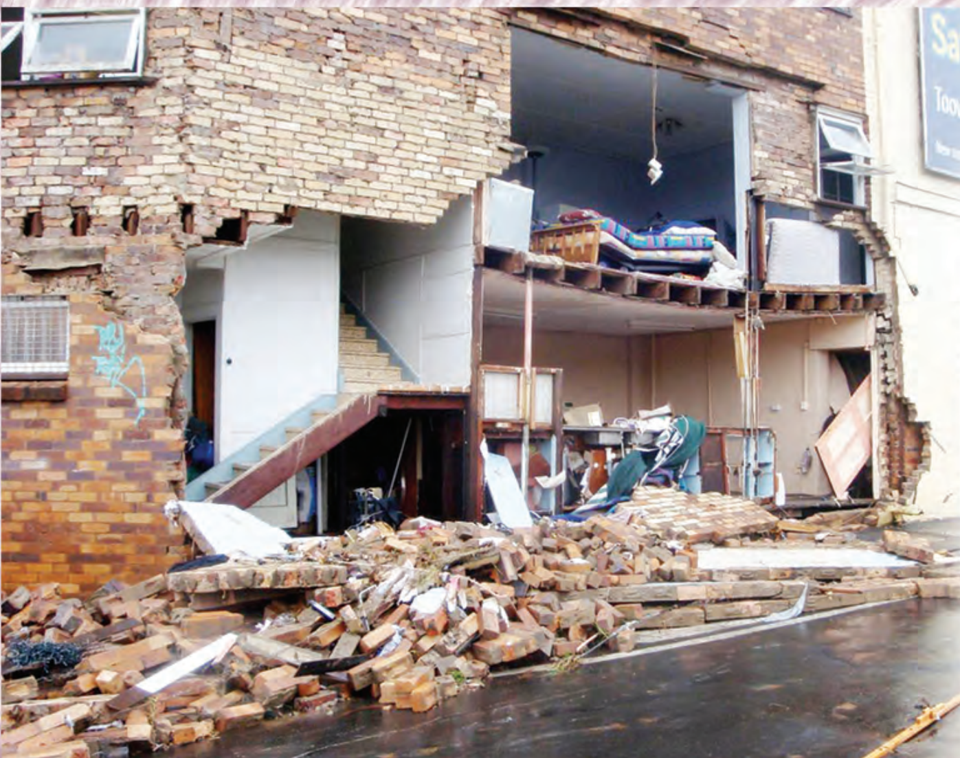
Haiwara brukim haus WANPELA bilding i klostu pundaun nau bihain long bikpela strongpela haiwara i ron i kam na brukim wanpela sait bilong dispela haus long Mande dispela wik.