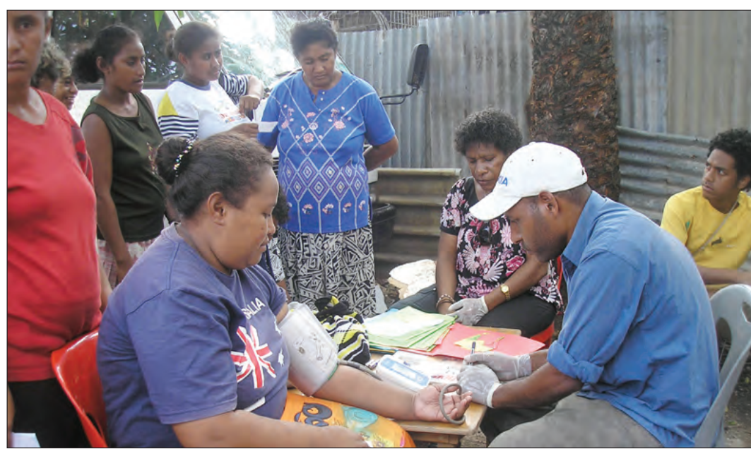
SEKIM: Opisa bilong Wol Visen i sekim blut bilong ol mama long Koki long sik suga we i kamap olsem wanpela bikpela laipstail sik long kantri. Fail Poto

Long ol ripot, Bogia Helt Senta i wok long givim marasin long 44 pipel wantaim sik kolera taim long Usino-Bundi, tupela pipel i dai na narapela tripela i kisim marasin i stap.