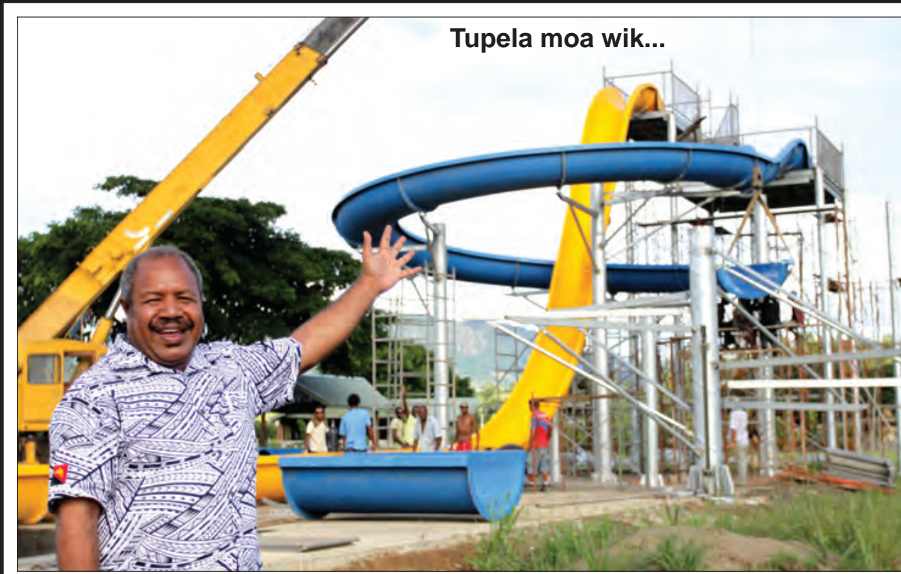
Tupela moa wik...