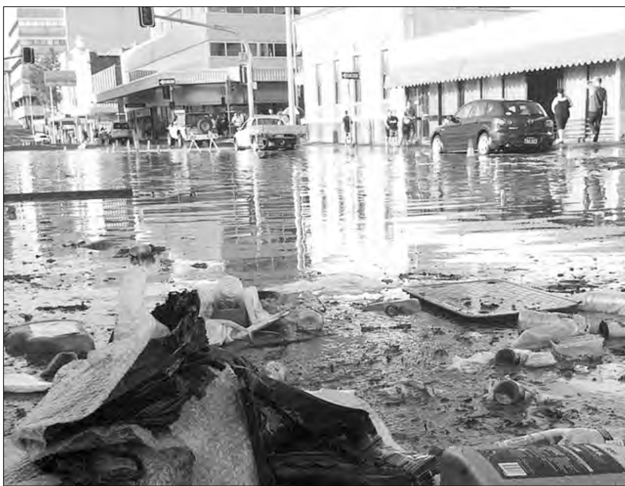
HAIWARA I PAINIM IPSWICH: Hia poto i soim hai- wara i go insait long bik rok bilong liklik taun long Ipswich long Brisbane Australia.