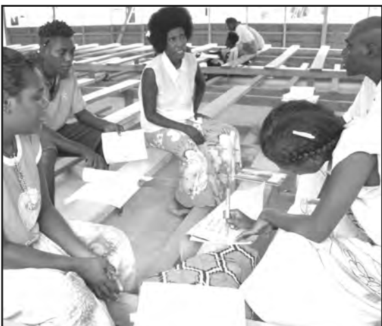
WOKSOP TAIM: Dispela em ol meri bilong Katerets (Carterets) Ailan, em wanpela long ol liklik ailan grup long Bogenvil, i wok long bungim bikpela hevi long solwara i karim. Ol i sindaun long wanpela woksop long kisim save long ol samting ol i ken mekim long lukautim gut laip na sindaun bilong ol na ol famili na komyuniti long dispela taim bilong hevi.