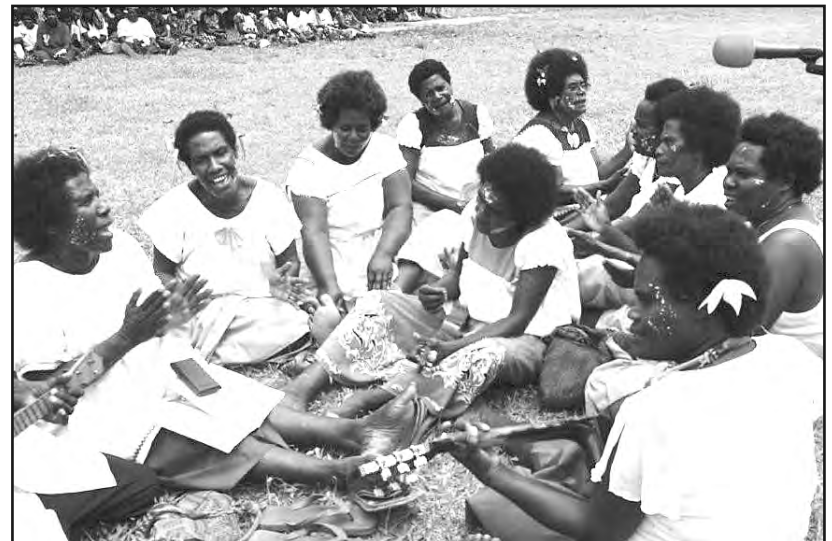
PAITIM GITA NA SINGSING: Dispela lain meri Bogenvil i soim olsem ol i ken paitim gita na singsing tu ya long wanpela Yunaitet Sios selebresen bilong ol Yunaitet Sios i bin kamap long Buka taun.