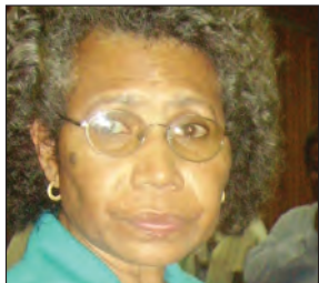
KIAP: Givim luksave long ol arapela.