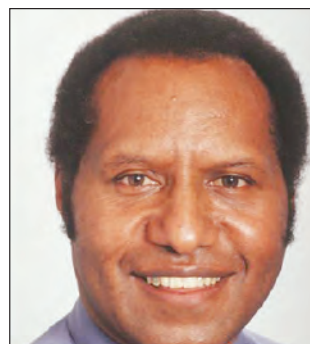
ABAL: Laikim senis.

Gavman i kolim dispela yia, 'Yia bilong Implemente-