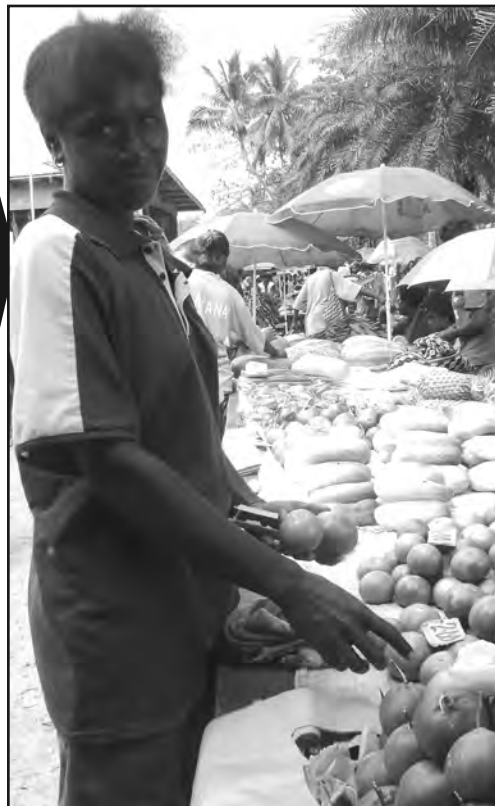
NAISPELA PRUT PULAP KAPSAIT: Olgeta taim, Buka maket i pulap i stap long ol pres prut olsem mandarim o swit muli, kukamba, popo, painapel, kumu, kulau na ol kain gaden kaikai, olsem long piksa we yangpela meri i baim i stap.