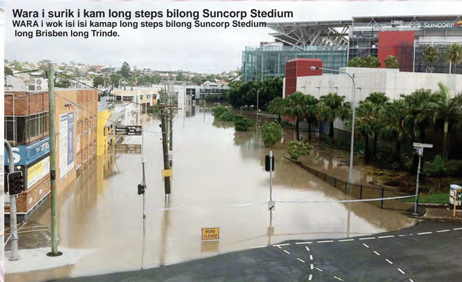
Wara i surik i kam long steps bilong Suncorp Stadium WARA i wok isi isi kamap long steps bilong Suncorp Stadium long Brisben long Trinde.