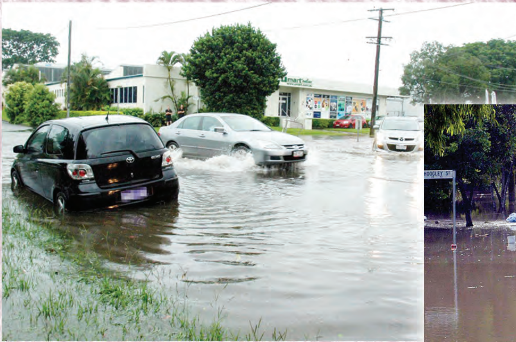
Ol taitwara i go antap yet long Brisben OL KAR i ron brukim haiwara i karamapim wanpela rot long Milton, wanpela sabeb long Brisben long Tunde dispela wik.