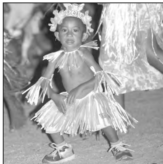
STAIL BILAS PIKININI: Dispela liklik pikinini Barakau i bin putim stail klos na selebretim kamap bilong nupela yia wantaim ol famili, hauslain nap les lain.