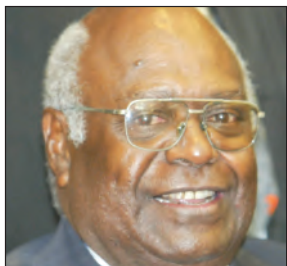
WAS STAP: Ogio, Minista bilong Haia Edukesen.