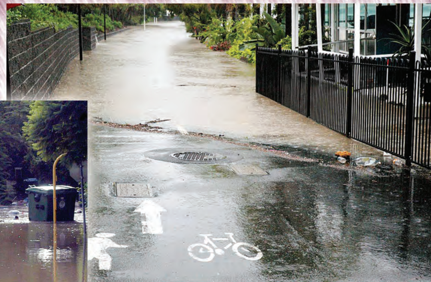
Taitwara mak i wok go antap moa BRISBEN Riva i kapsait i go bihainim rot bilong wilwil bihainim sait bilong em long Coronation Drive, Milton, taim bikpela ren moa i wok pundaun long Janueri 11.